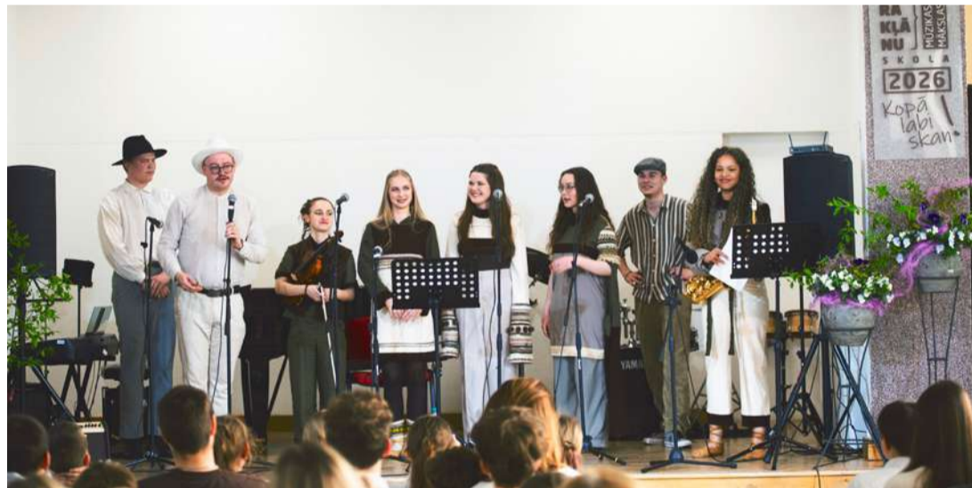
Etnodžeza grupas "Šalīts".

"Stīgu trio", Pļaviņu Mūzikas skolas pušaminstrumentu ansamblis un Varakļānu mūzikas un mākslas skolas jauktais ansamblis.