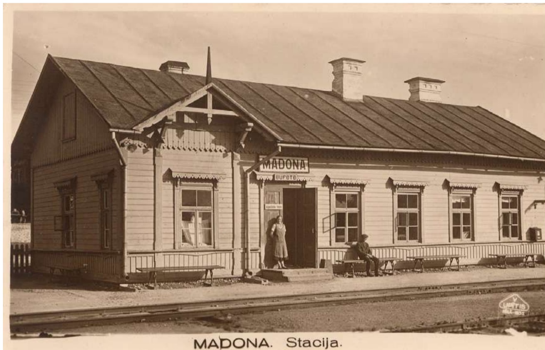
Dzelzceļa stacija Madonā. 1935. gads.

Biržu staciju 1921. gada novembrī oficiāli pārsauca par Madonu. To pārzināja Satiksmes ministrijai Dzelzceļu virsvalde. Ar 1929. gada maiju maršrutā Rīga–Madona tika ieviests guļamvagona, ar kuru no galvaspilsētas varēja atbraukt 6 stundās. Madonā vilciens pienāca 6.00 no rīta.