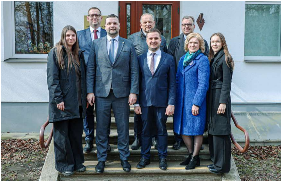
Labklājības ministrs Reinis Uzulnieks (trešais no kreisās) kopā ar Madonas novada pašvaldības pārstāvjiem iepazīst sociālo pakalpojumu sniegšanas vietas.

"Šādas reģionālās vizītes man ir ļoti svarīgas – tās dod iespēju klātienē iepazīt gan sasniegumus, gan problēmas. Madonas novadā redzams, ka tiek ieguldīts liels darbs un resursi, lai atbalstītu ģimenes un veidotu vidi, kur cilvēki