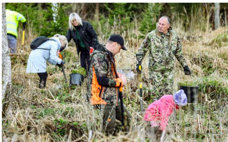
Priežu stādīšana Smeceres silā.

Madonas novada pašvaldība individuāli talkoja jau 17. aprīlī Smeceres silā, atjaunojot mež-