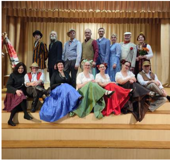
Cesvaines tautas teātra dalībnieki darbojas radoši.

Starp 67 Latvijas amatiereteātriem reģiona skatē piedalījās arī divi Madonas novada amatiereteātri, kuri ieguva augstus novērtējumus: