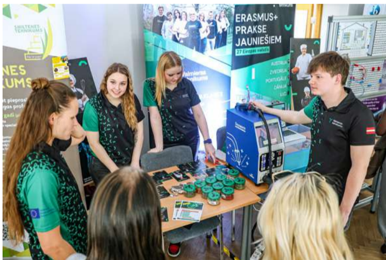
Valmieras tehnikuma komanda.

2026. gada 17. martā Madonā pašvaldības domes ēkā norisinājās karjeras atbalsta pasākums "Ātrie randiņi ar Vidzemes reģiona profesionālajām skolām", pulcējot vairāk nekā 170 9. klašu skolēnus, skolotājus un profesionālās izglītības iestāžu pārstāvjus. Pasākuma mērķis bija palīdzēt jauniešiem labāk izprast savas nākotnes iespējas un iepazīt dažādas profesijas.