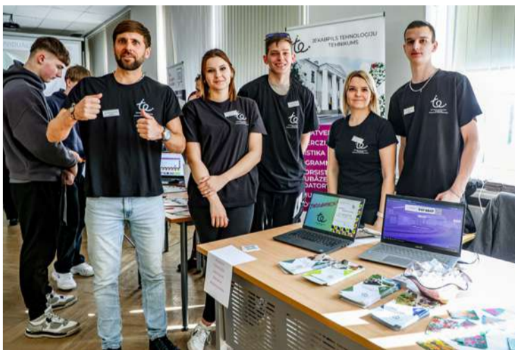
Jēkabpils Tehnoloģiju tehnikuma Barkavas struktūrvienības komanda.

Šāda formāta tikšanās – "ātrie randiņi" – ļāva īsā laikā iepazīt vairākas izglītības iestādes un salīdzināt to piedāvātās iespējas.