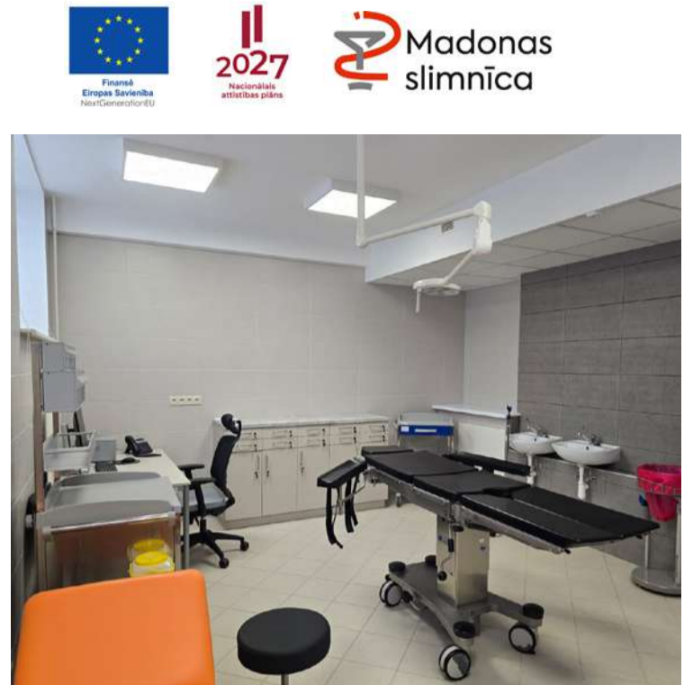
Atjaunotās telpas sekmēs efektīvāku darba organizēšanu un augstāku pakalpojumu kvalitāti.

Veiksmīgi noslēgusies Atvaseļošanās fonda projekta "Madonas novada pašvaldības SIA "Madonas slimnīca" infrastruktūras uzlabošana, nodrošinot ilgtspējīgus integrētus veselības pakalpojumus", ident. Nr. 4.1.1.3.i.0/1/23/1/CFLA/034 īstenošana Madonas slimnīcas Neatliekamās medicīniskās palīdzības un pacientu uzņemšanas nodaļā. Projekta īstenošana tika uzsākta 2024. gada 24. janvārī.