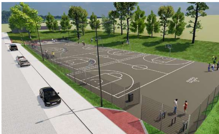
Projekta vizualizācija Madonā, pie Priežu kalna basketbola laukuma.

Esošajā basketbola laukumā tiks izveidota jauna ieeja no Veiden-