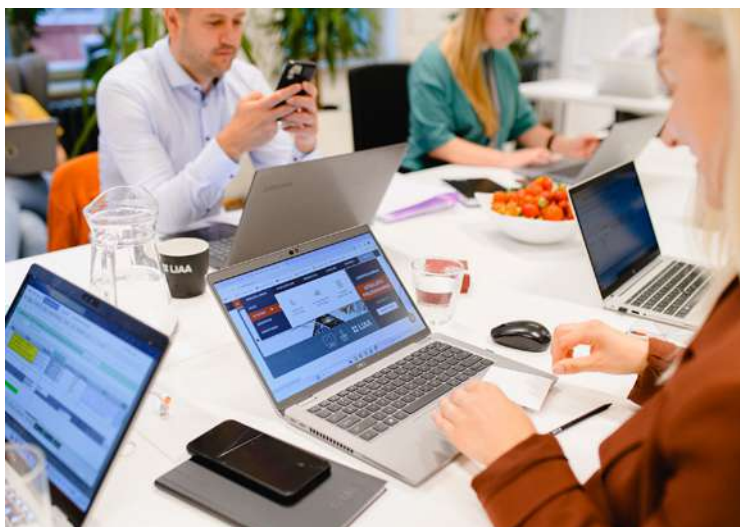
LIAA reģionālo pārstāvniecību darbinieki.

Iepriekšējā uzsaukumā šī gada pavasarī inkubācijas programmai LIAA pārstāvniecībā Madonā pievienojās uzņēmums SIA “Etna Design”, kas ražo dārza mēbeles, iekaramos grozus un dekorus no bazalta šķiedras. Izstrādātā teh-