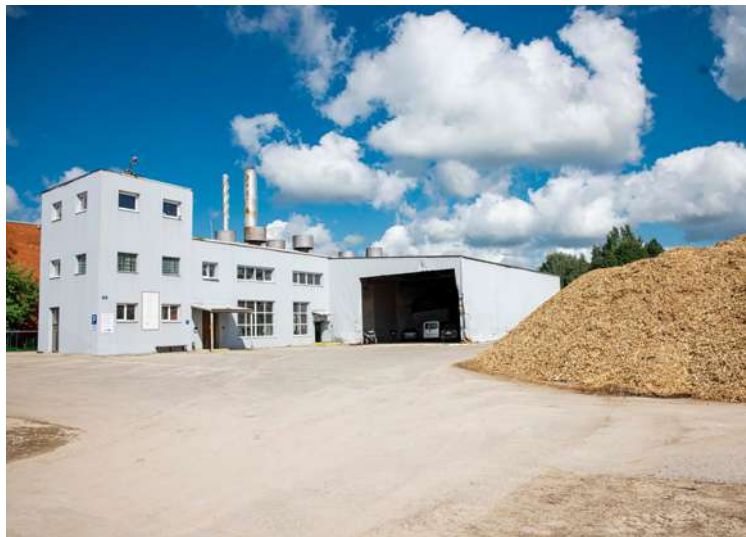
Kurināmais visai nākamajai sezonai ir sagādāts, katlumājas sagatavotas darbam.

mas, uzņēmums pēdējo sešu mēnešu laikā ir veicis vairākus uzlabojumus.