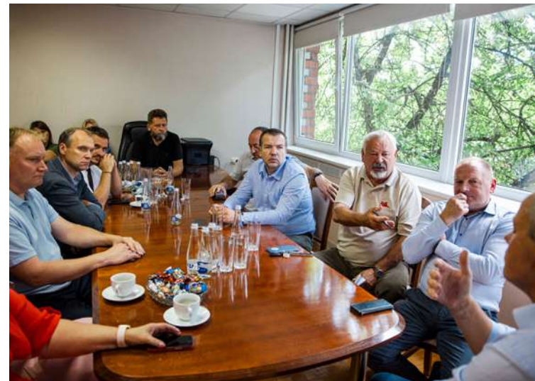
Madonas novada domes deputāti tiek ar SIA "Madonas Siltums" pārstāvjiem.

Gaidāmajai apkures sezonai, Madonas pilsētā pirmo reizi izdevies mēģinājums iepirkt kurināmo, norēķinoties nevis saskaņā ar piegādātājiem berkubiem, bet gan pēc saražotās siltumenerģijas daudzuma (MWh).