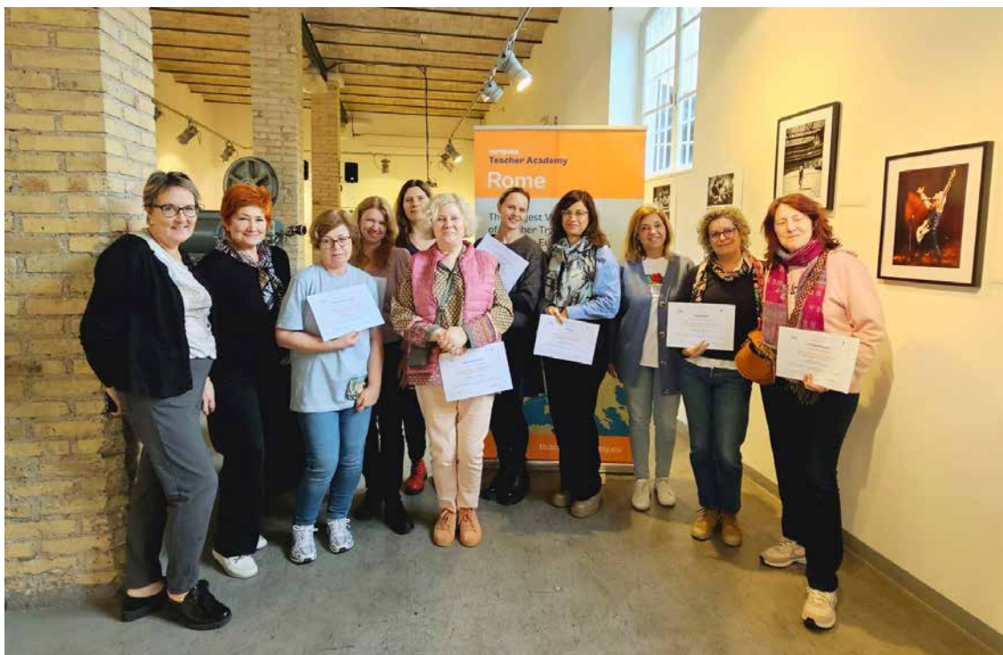
Pedagogu profesionālās pilnveides kurss “Digitālā labbūtība – jauns izaicinājums skolotājiem un skolēniem” Romā.

Otrā mobilitāte notika no 2024. gada 26. februāra līdz 1. martam Itālijā, Romā. 3 pedagogiem bija iespēja piedalīties pedagogu profesionālās pilnveides