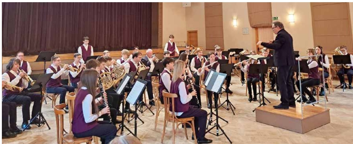
Jāņa Norviļa Madonas Mūzikas skolas pūtēju orķestris “Vivo” skatē ieguva I pakāpes diplomu.

1. martā Madonas novada kultūras centrā tika aizvadīta Latvijas izglītības iestāžu pūtēju orķestru Latgales un Vidzemes novadu skatē. 20 kolektīvi, 647 jaunie orķestranti no Madonas, Rīgas, Ogres, Cēsim, Daugavpils, Alūksnes, Si-