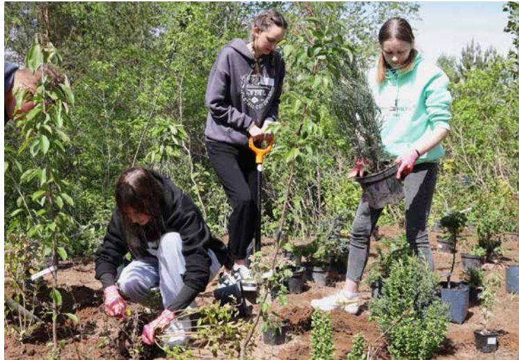
Stādīšanas svētki "Dzintaros", Ļaudonā.

Projekta aktivitātēm piešķirts Madonas novada pašvaldības finansējums, tā ietvaros vēl tiks organizēts skrējienu cikls "Ģimenes aplī", sporta spēles ar bumbām „Bumbojam!“ bērniem un viņu ģimenēm maija beigās un orientēšanās pasākums rudenī.