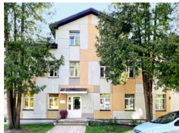
Deleģē biedrībai "Latvijas

Samariešu apvienība" pārvaldes uzdevumu – dienas centra pakalpojuma pilngadīgām personām, dienas aprūpes centra pakalpojuma pilngadīgām personām ar garīga rakstura traucējumiem, krīzes centra pakalpojuma, zupas virtuves pakalpojuma, higiēnas pakalpojuma sniegšanu no 2024. gada 1. jūnija uz trīs gadiem. Apstiprina deleģēšanas līgumu.