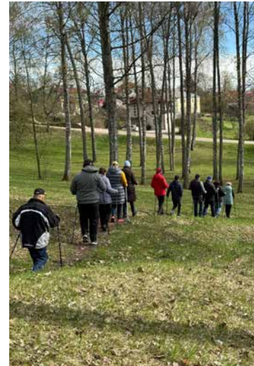
"Kusties šodien, vesels – rītdien".

■ Liela esošajam klimatam atbilstošu stādu daudzveidība. Stādīšanai tika izvēlēti gan dekoratīvie, gan augļus dodošie koki un krūmi. Kopā – ap 100 dažādu