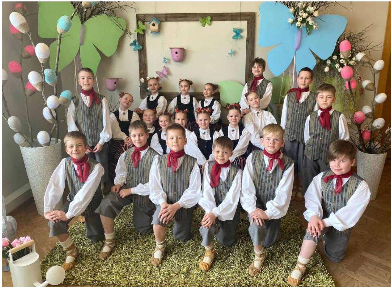
Madonas novada kultūras centra deju kolektīvs "Pipariņi" deju skatē ieguva Augstākās pakāpes diplomu.