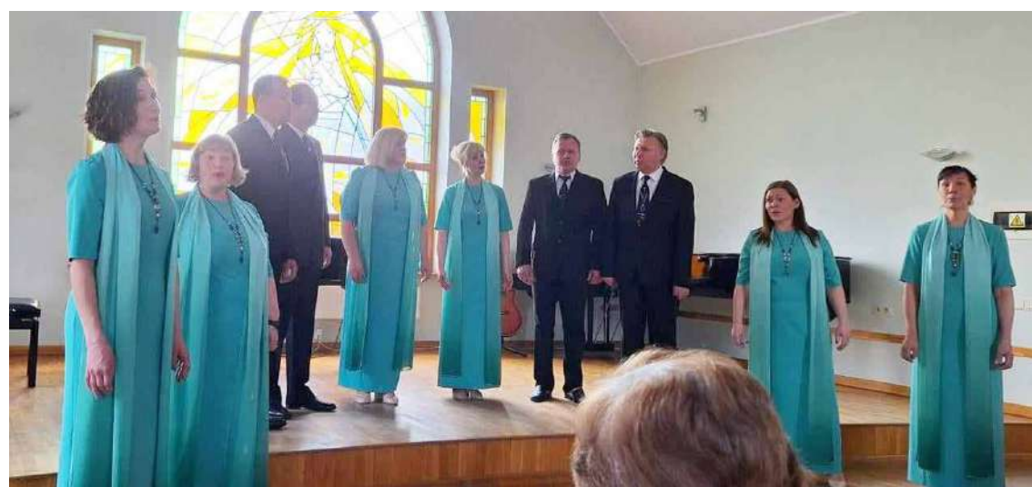
Vislielāko punktu skaitu ieguva Tautas nama “Kalnagravas” jauktais vokālais ansamblis “Rondo”.

Žūrijas komisijas locekļi visu ansambļu sniegumu skatē kopumā vērtēja ļoti atzinīgi. Pārsniedzot 40 punktus, tika iegūti pieci I pakāpes diplomu – visaugstākais punktu skaits 42,55 piešķirts Tautas nama “Kalnagravas” jauktā