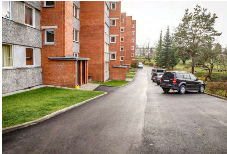
Jau īstenotie projekti Madonas daudzdzīvokļu māju pagalmos.