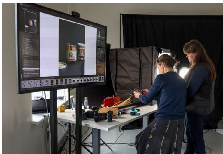
Digitālajā darbnīcā top produktfoto.

Informāciju sagatavoja INGA STRAZDIŅA, Centrālās administrācijas Attīstības nodaļas vecākā speciāliste jaunatnes un ģimenes politikas jomā