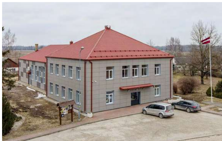
Uzlabota energoefektivitāte Degumnieku pagasta pārvaldes ēkai, kur atrodas arī tautas nams un bibliotēka.

Būvdarbi tika uzsākti 2023. gada jūlijā. To ietvaros tika veikta ēkas ārējo siltināšana, logu ailu siltināšana, ēkas bēniņu siltināšana, pagrabā pārseguma un cokola siltināšana, ēkas visu logu nomaīņa, visu ārdurvju no-