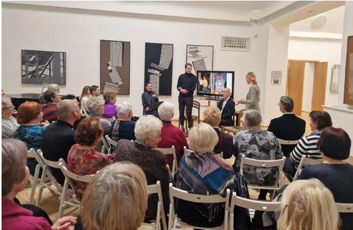
Mirkļis no pasākuma Madonas muzejā. Ar atmiņām par Visvaldi dalās viņa mazbērni.

Padomju gados nacionālistisko uzskatu dēļ un izteiktās nepatikas