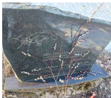
Pirms 20 gadiem, 25. martā atklātais piemiņas akmens represētajiem iedzīvotājiem Bērzaunē. 2024. gads.

Visticamāk, lielākajai sabiedrības daļai zināmākā no tām ir Šķeltais akmens Madonā, pilsētas vecās dzelzceļa stacijas vietā. Bet novadā, ieskaitot pilsētu, ir vairāk