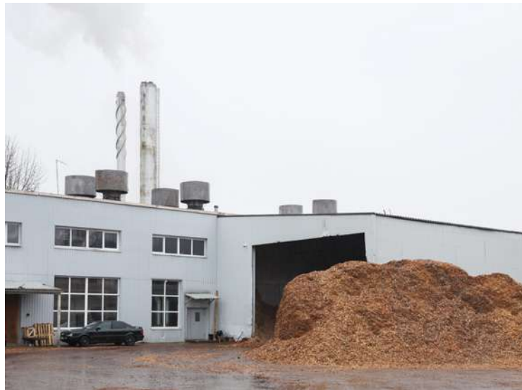
SIA "Madonas Siltums" šā brīža prioritāte ir uzņēmuma finansiālās situācijas nostabilizēšana un resursu kontrole.

Iespējami ātrākā laikā tiks veikta SIA "Madonas Siltums" jauna valdes locekļa nominēšana pēc valdes locekļa amata pretendenta atlases, piemērojot atklāta konkursa procedūru atbilstoši normatīvajam regulējumam.