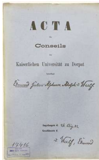
Apkopotie materiāli, kas glabā Cesvaines pils un Vulfu dzimtas laika zīmogu.