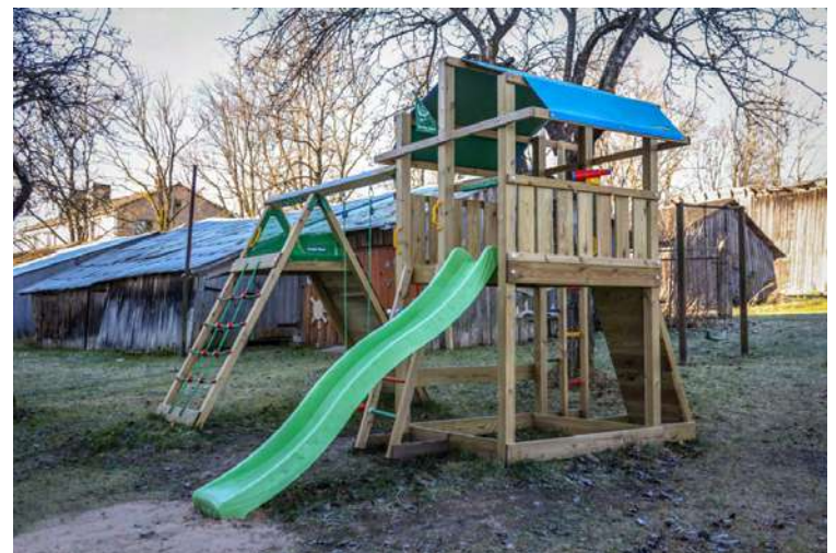
AGRA VECKALNIŅA foto no arhīva

Līdzfinansējums katrā apakšpunktā noteiktajam pasākumam katrai dzīvojamai mājai tiek piešķirts vienu reizi, atbilstoši paš-