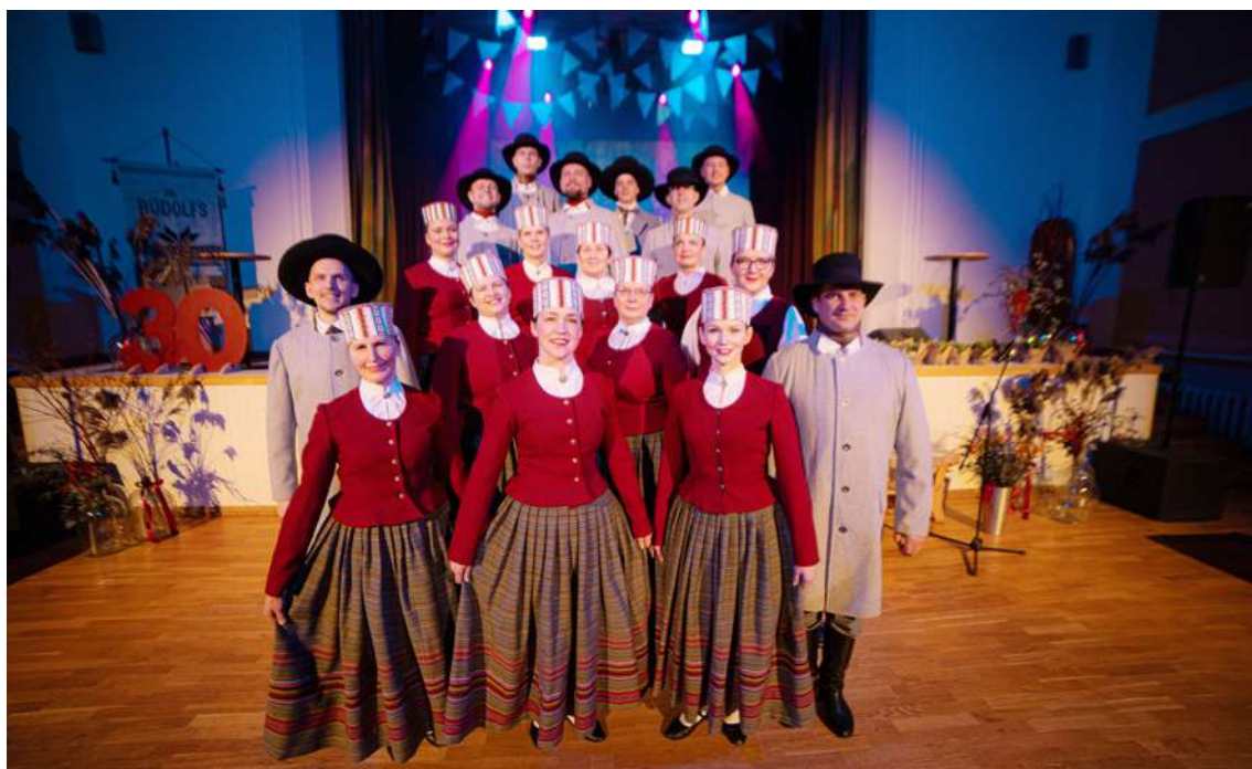
Vidējās paaudzes deju kolektīva “Rūdolfis” kolektīvs.