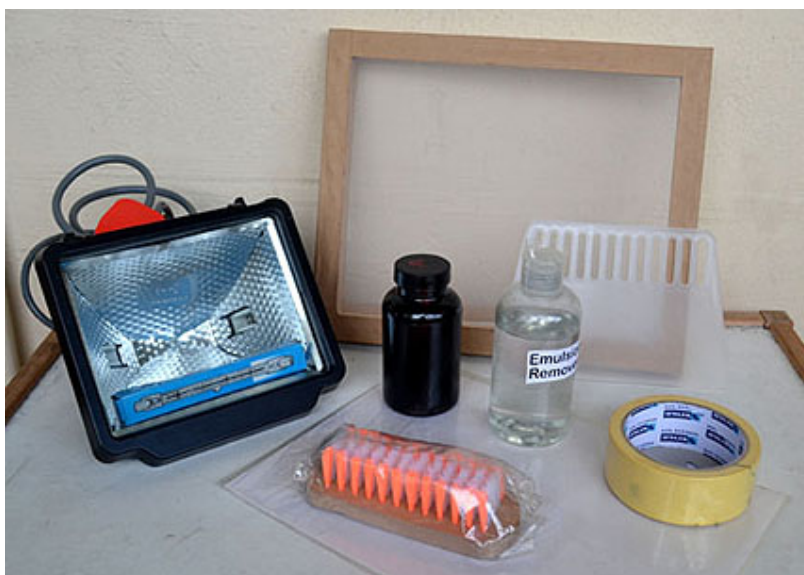
Attēlā redzami materiāli sieta izgaismošanai