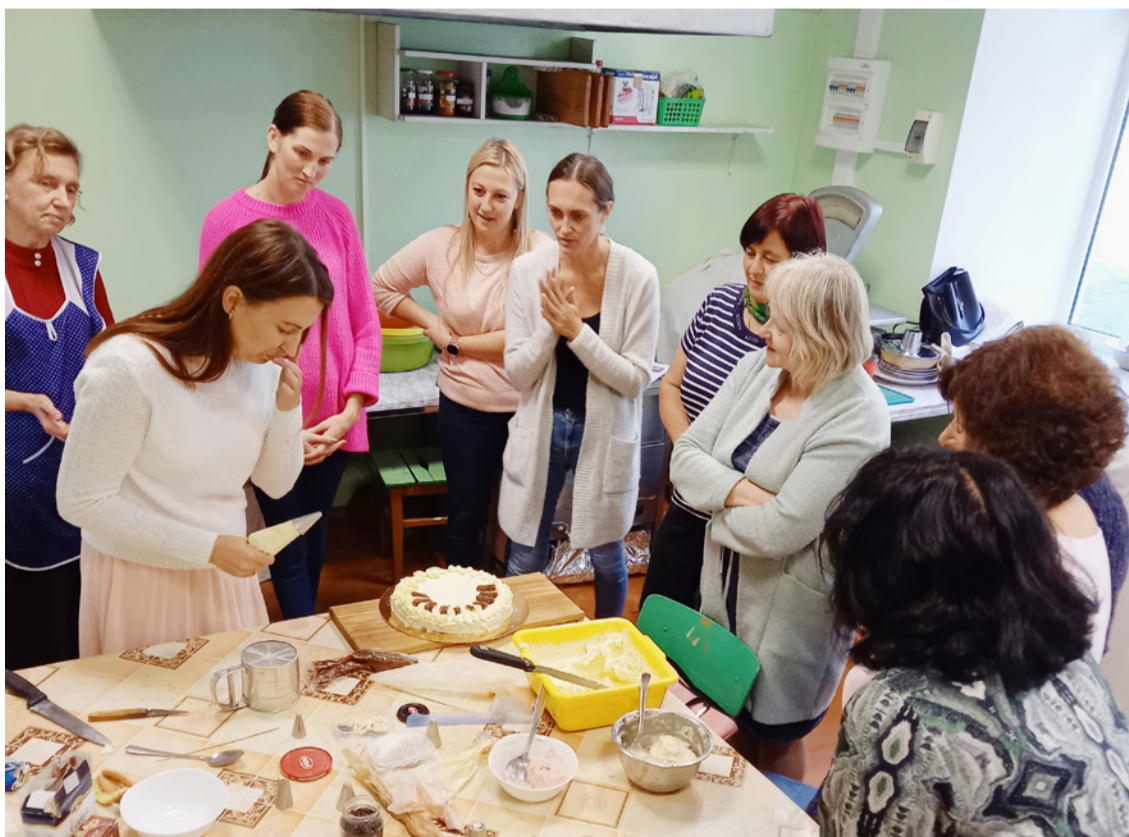
Meistarklases Amatu skolā akcijas "Satiec savu meistarū" ietvaros apmeklēja liels skaits interesentu.

Kā atzina abas meistarklasu vadītājas, – prieks, ka interese par latviskām tradīcijām un prasmēm neizdab, un piesaista arvien jaunus interesentus, un kā pie-