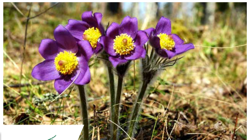
Meža silpurene – raksturīgā osu mežu augu suga.