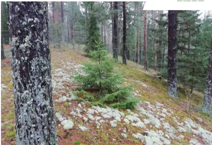
Vēl neaizauguši laukumi, kuros sastopamas raksturīgās sugas.