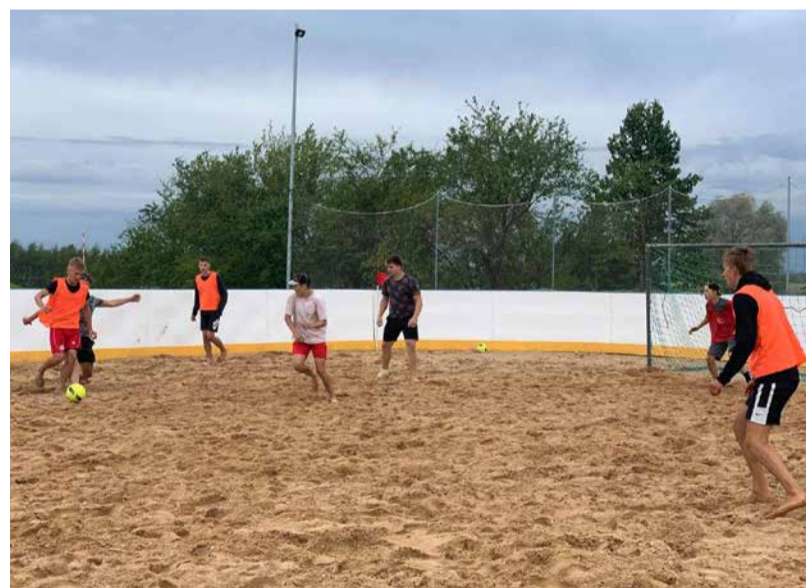
„Ķikuta kausa izcīņa”. Ošupes pagasts.