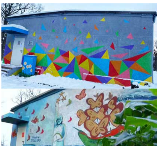
“Iekrāso pats savas radošās mājas!”. Praulienas pag.