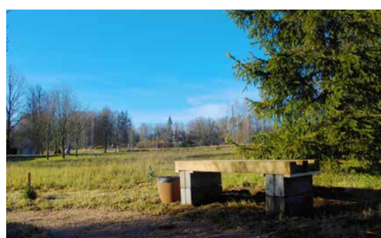
“Mārcienas dabas parka izveide”.

Jau trešo gadu Madonas novada pašvaldībā jauniešiem tika dota iespēja iesniegt un realizēt savus projektus. Projektu konkurss jau iepriekš ir raisījis lielu jauniešu interesi.