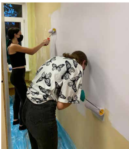
“Krāsainā atgriešanās.” Liezēres pagasts.