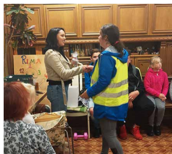
“Nakts orientēšanās 2021”. Lazdonas pagasts.