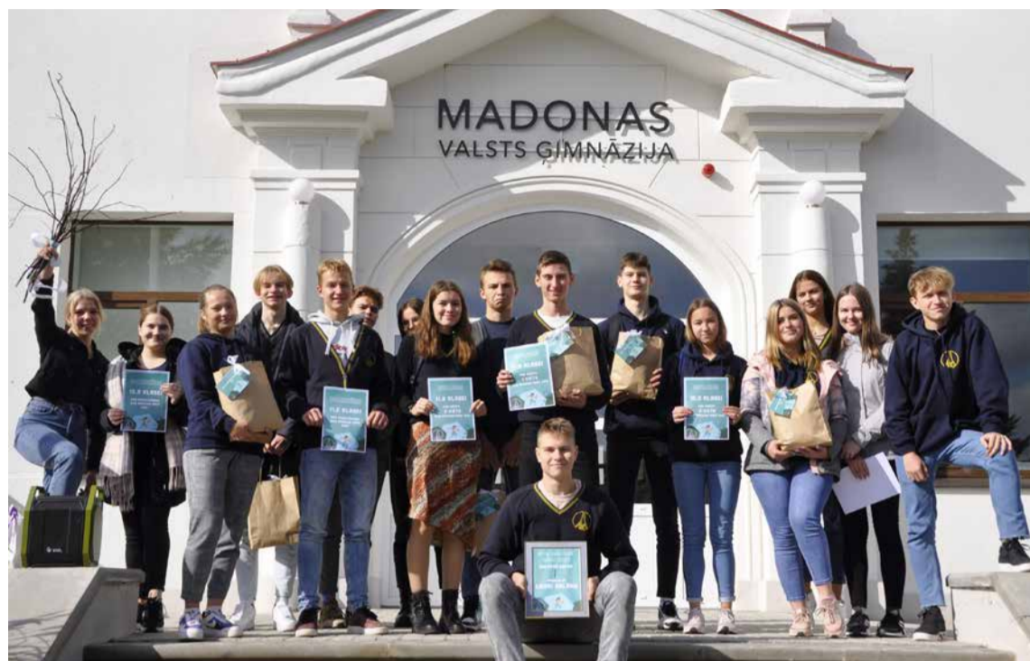
“MVĢ amazing race”. Madonas Valsts ģimnāzija.