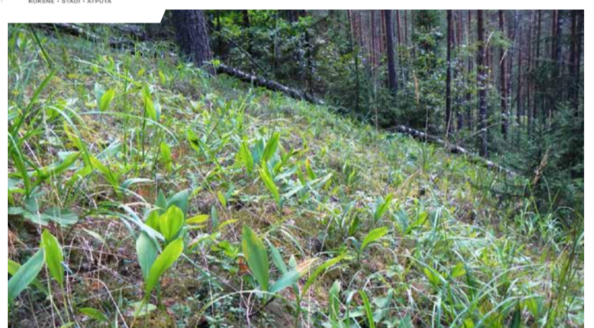
Šaurlapu lakacis – suga, kuru varētu gaidīt atpakaļ.

Šī gada pirmajā pusē Driksnas silā notika vairākas sanāksmes, kurā AS "Latvijas valsts meži", Dabas aizsardzības pārvaldes, Valsts meža dienesta pārstāvji diskutēja un vienojās par dabas parka veicamajiem dzīvotņu uzlabošanas un atjaunošanas darbiem.