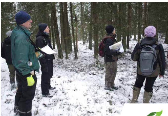
Sanāksme dabā un darbu plānošana.

Dabas parka teritorijā aug tādas īpaši aizsargājamas, gaismas prasīgas augu sugas kā Ruiša pūķgalve, meža silpurene, garkāta ģipsene, Prūsijas smiltāja nelķe, šaurlapu lakacis un zāļlapu smiltenite. Noēnotās vietās tās slikti zied un neveido sēklas, pie tam tās ir jutīgas ne tikai pret koku un krūmu radīto noēnojumu, bet arī pret citu lakstaugu un sūnu sugu konkurenci. Nereti tās sastopamas vairs tikai ceļmalās un gar stigām, kur atsegta grants un vairāk apspīd saule.