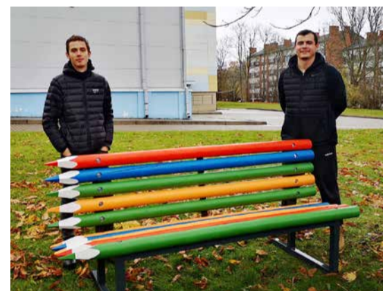
“KKK” Košie Krēsli Kusai. Aronas pagasts.