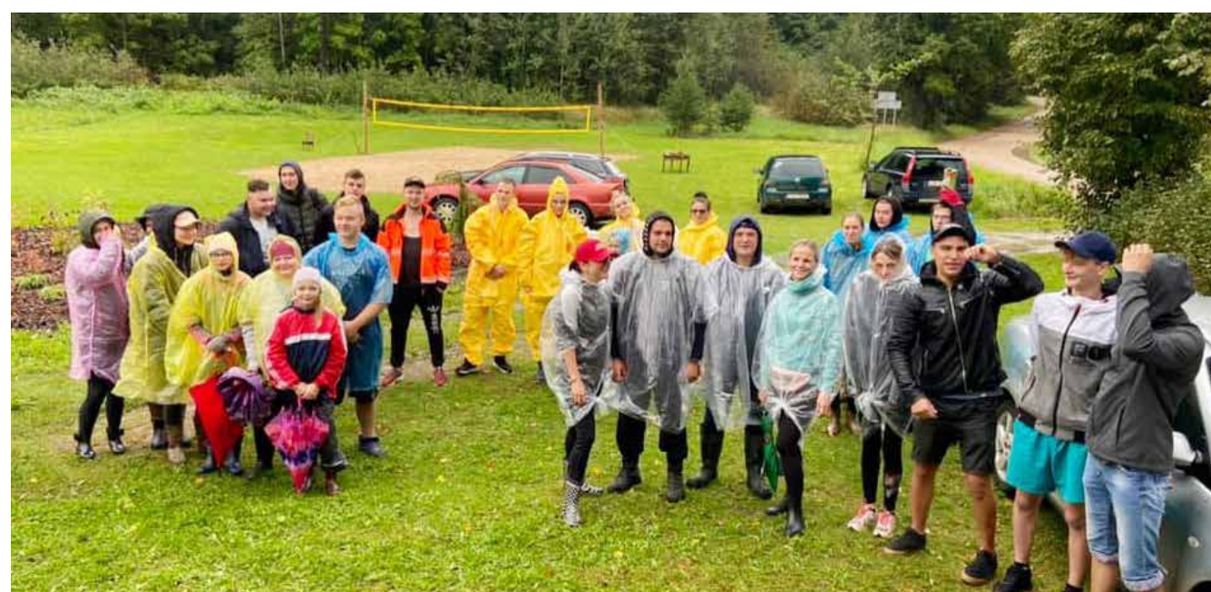
Sadraudzības pasākums “Lauku sēta”. Kalsnavas pagasts.