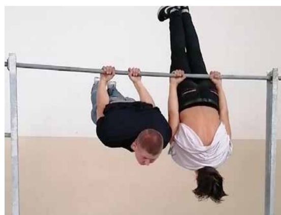
“Vingrošanas stienis Ļaudonai”.