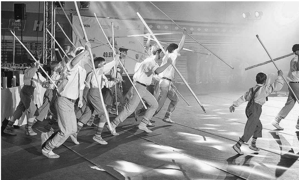
Starptautiskā meža darbinieku biatlona čempionāta (EFNS) noslēguma pasākums Madonas pilsētas Sporta centrā.