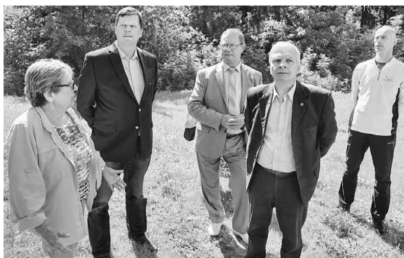
Situācijas novērtēšanas brīdī Gaiziņkalnā.