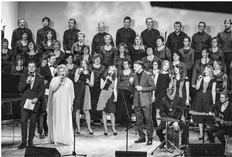
Madonas jubilejas izskaņas koncerts Ziemassvētkos.