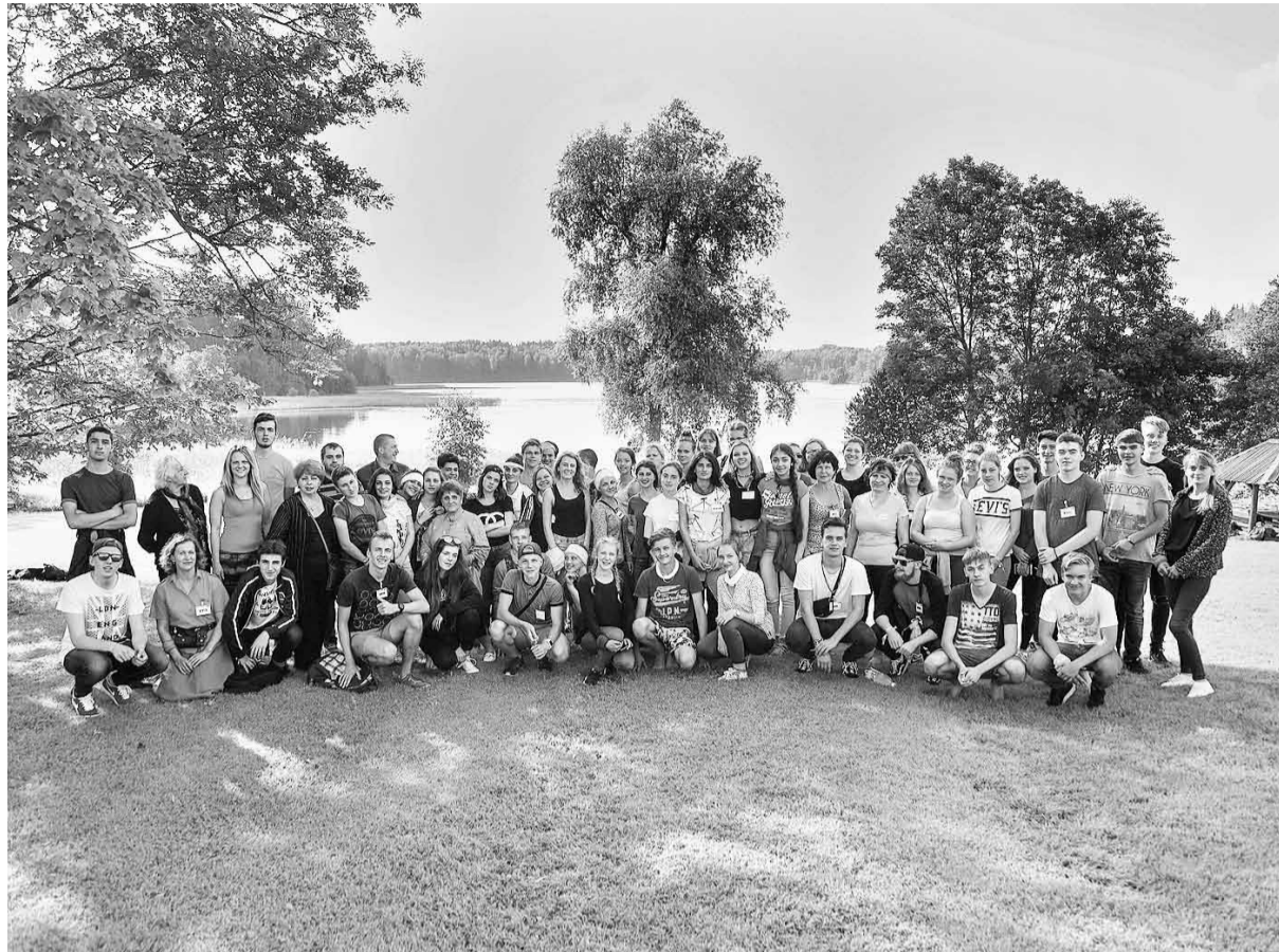
Starptautiskās jauniešu nometnes dalībnieki pie Kāla ezera.

Nometnes organizatori bija parūpējušies par ikviena dalībnieka labsajūtu. Dalībniekiem ierodoties, valstu pārstāvji tika dalīti pa dažādām komandām, lai veidotos ciešāks dialogs starp valstu jauniešiem. Pirmās dienas bija vērojamas nelielas jauniešu