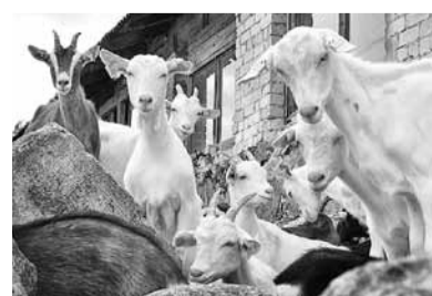
ZS „Līvi” kaziņam siens ziemai jau sarūpēts.