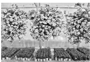
„Puķu sētā” vasaras puķes pašā plaukumā.