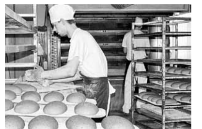
Tā top Madonas maize.