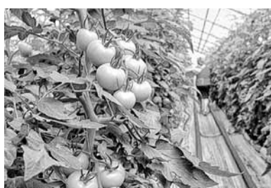
SIA „Aiva G” siltumnīcās pašlaik ražas pilnbrieds.