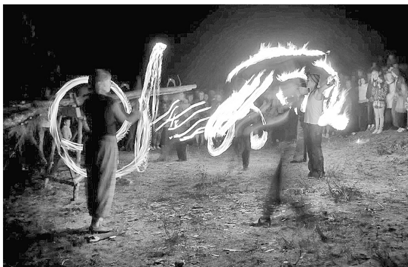
Skatītāji bija liecinieki ne tikai degošām uguns skulptūrām Biksēres ūdenskrātuvē, bet arī aizraujošam uguns žonglieru sniegunam.