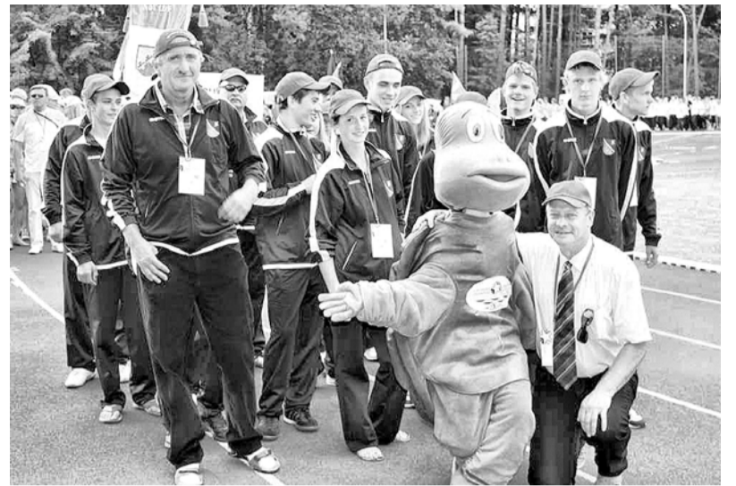
Madonieši Latvijas Jaunatnes vasaras Olimpiādē Jūrmalā.