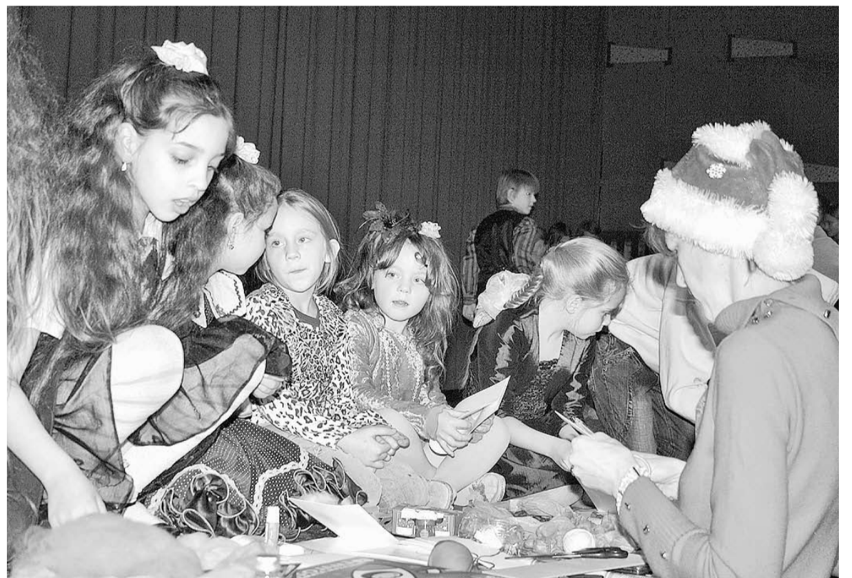
Bērni ar interesi iesaistās radošās darbnīcās

Akcijas „Karameles” koncertā Lazdonas luterāņu baznīcā tika saziedots ap 150 dažādu dāvanu – apģērbu, pārtiku, rotaļlietas, grāmatas, kalendārus utml., kas tālāk ar Madonas evaņģēliski luteriskās draudzes diakonijas darbinieku palīdzību tika dāvētas 45 zupas virtuves apmeklētājiem, 30 dāvanas maznodrošinātās ģimenes saņēma sociālajā dienestā, bet 40 maznodrošinātām ģimenēm – veciem ļaudīm