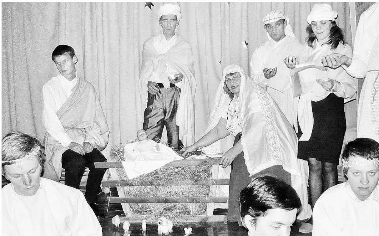
Rupsalas iemītniekiem bijušajā skolas zālē ir pašiem sava skatuve, uz kuras tiek veidoti dažādi uzdevumi. Arī aizvadītajos Ziemassvētkos.

Sadarbībā ar Labklājības ministriju šeit savu mājvietu raduši arī pagasta iedzīvotāji (valsts finansēto aprūpes iestāžu pretendenti stāv kopējā rindā, neskatoties uz viņu esošo dzīvesvietu). Pagasts par saviem