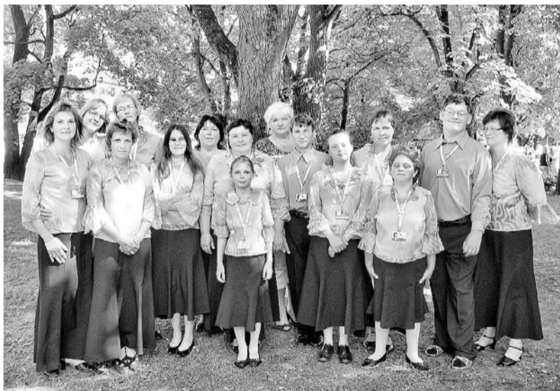
Kolektīva dalībnieki teic: „Šāda veida deju grupa Latvijā ir vienīgā, vismaz mēs otru nezīnām. Ar to mēs ļoti lepojāmie.”