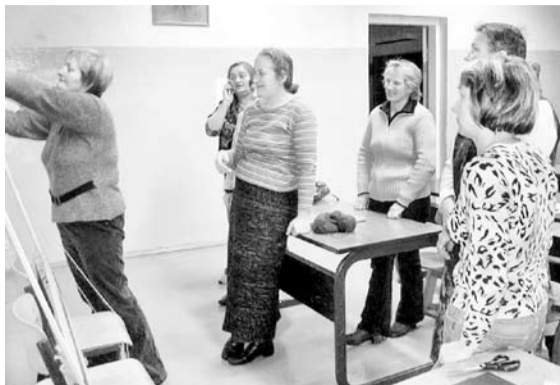
Rokdarbu pulciņa dalībnieces.

Pirmajā tikšanās reizē tika izteiktas vēlmes, ko katra no dalībniecēm vēlētos iemācīties. Adīt, tamborēt vai izšūt prot daudzas sievietes, bet arī strādājot šos rokdarbus, arvien var atklāt ko jaunu. Laika gaitā plānots apgūt dažādas citas rokdarbu