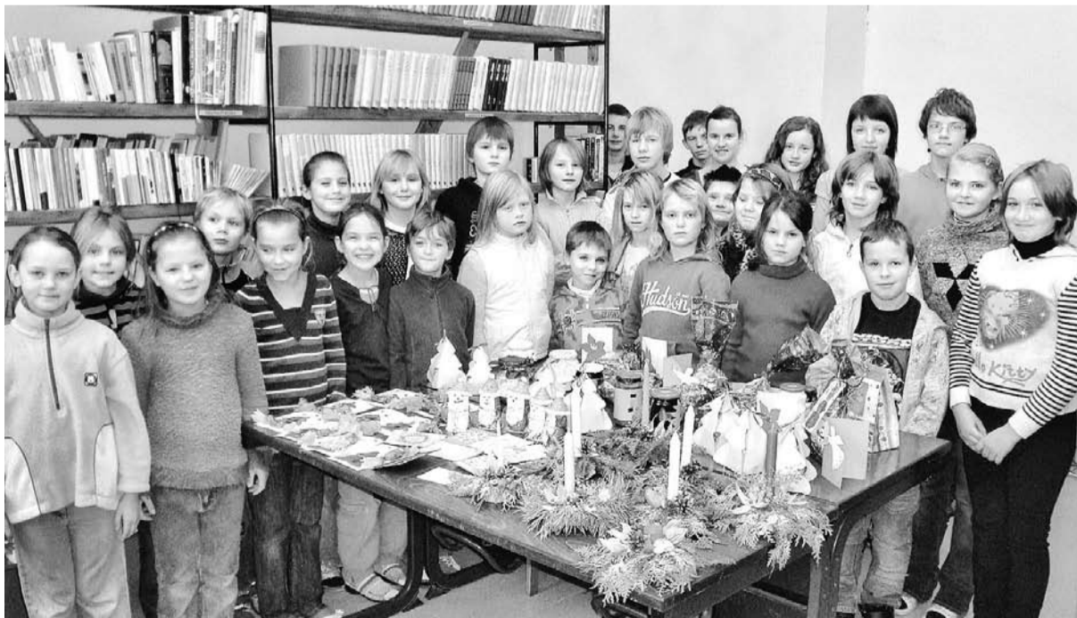
Katra sagatavotā dāvāniņa – no sirds.

Jau no 6. decembra Vestienas pamatskolas skolēni, skolotāji un vecāki aktīvi iesaistījās labdarības akcijas īstenošanā un dāvāniņu gatavošanā – paši cepa cepumus, veidoja kompozīcijas, zīmēja un rakstīja apsveikumus, glīti izdekorēja ievārijuma un citu gardumu burciņas, iepakojā