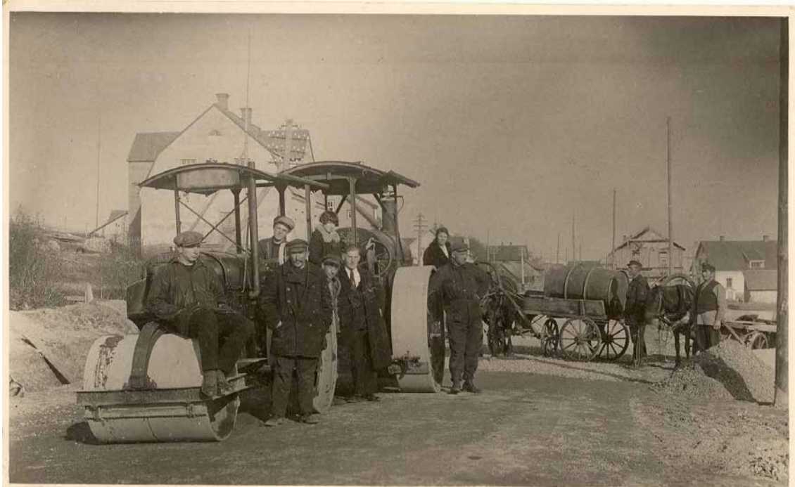
Ceļu darbi Madonā, 1930. gads.