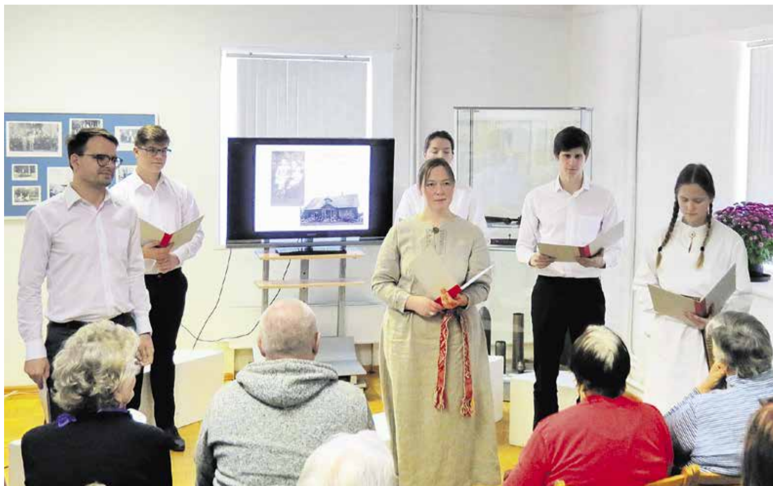
“Neatkarības kara korespondence” vēstuļu lasījumi Madonas muzejā.

Jau 10. gadu pēc kārtas Latvijas Muzeju biedrība organizē Latvijas Muzeju biedrības Gada balvu, kas ir vienīgā šādas nozīmes balva muzeju nozarē, kā arī viena no biedrības aktivitātēm nozares izcilības piemēru un radošuma veicināšanai.