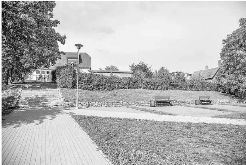
Nākamvasar dobes Mūzikas skvērā pie kultūras nama un skvērā pie kapelas rotās krāšņas hortenzijas.

26. septembrī Madonā pulcēsies ap 200 Vidzemes izglītības iestāžu skolēnu, lai iepazīstinātu ar savu veikumu, kā arī gūtu ieskatu un novērtētu citu paveikto. Vi-