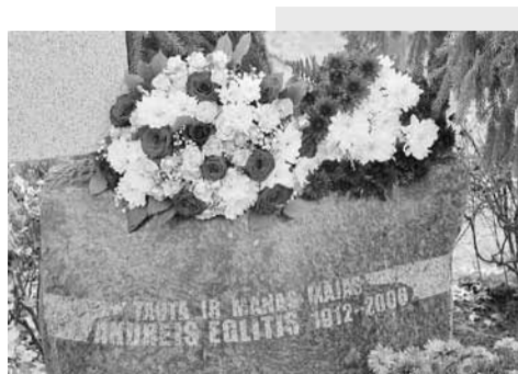
Dzejnieka atdusas vieta Ļaudonas kapos un pagasta simbolika.

A.Eglīša atdusas vieta pildījās ar rudens ziediem un sveču liesmām – pieminēt dzejnieku bi-