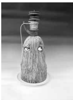
Skuja Braden “Vērpēja”.

Līdzās keramikai varēs palūkot uz Latviju – tās dabu un cilvēkiem, caur itaļu izcelmes fo-