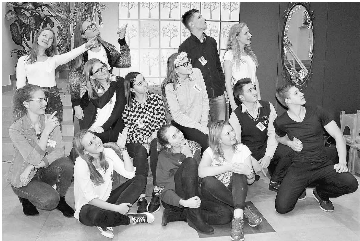
Jaunievēlētās Jauniešu domes sastāvs.