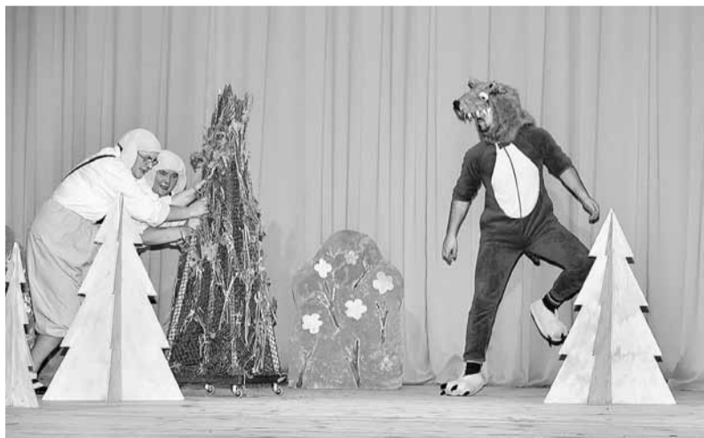
Skatītāju simpātija – amatiereteātrim “Ugāles Drāma”, iestudējumam “Trīs sivēniņi un vilks”.