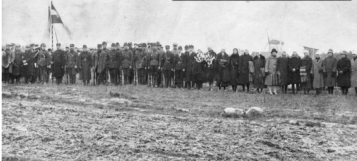
Apsveikuma pastkarte (1920. gadi) un mītiņš 1928. gada 18. novembrī Saikavā.