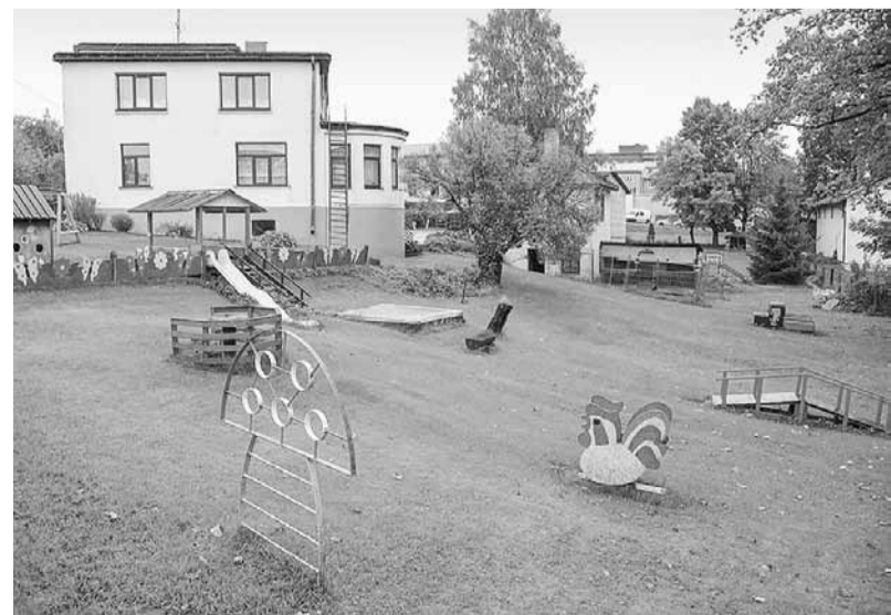
Pašreizējais Madonas PII “Kastanītis” rotaļu laukums pirms jauno rotaļu iekārtu uzstādīšanas.

Sagatavoja AGNESE SILUPA, Madonas novada pašvaldības ainavu arhitekte