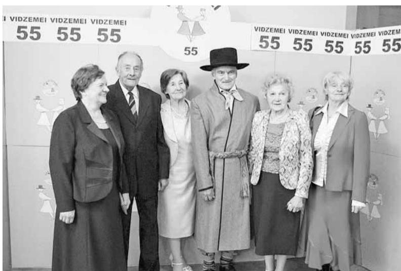
Pirmais "Vidzemes" sastāvs, kas izcīnīja TAD "Vidzeme" nosaukumu.