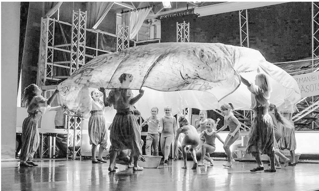
Deju grupas "Aliens" 20 gadu jubilejas koncertuzvedums "Izlaušanās".