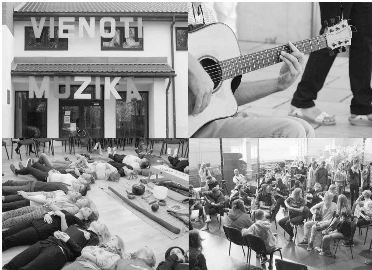
Ģitāristu sesijas mirkļi.