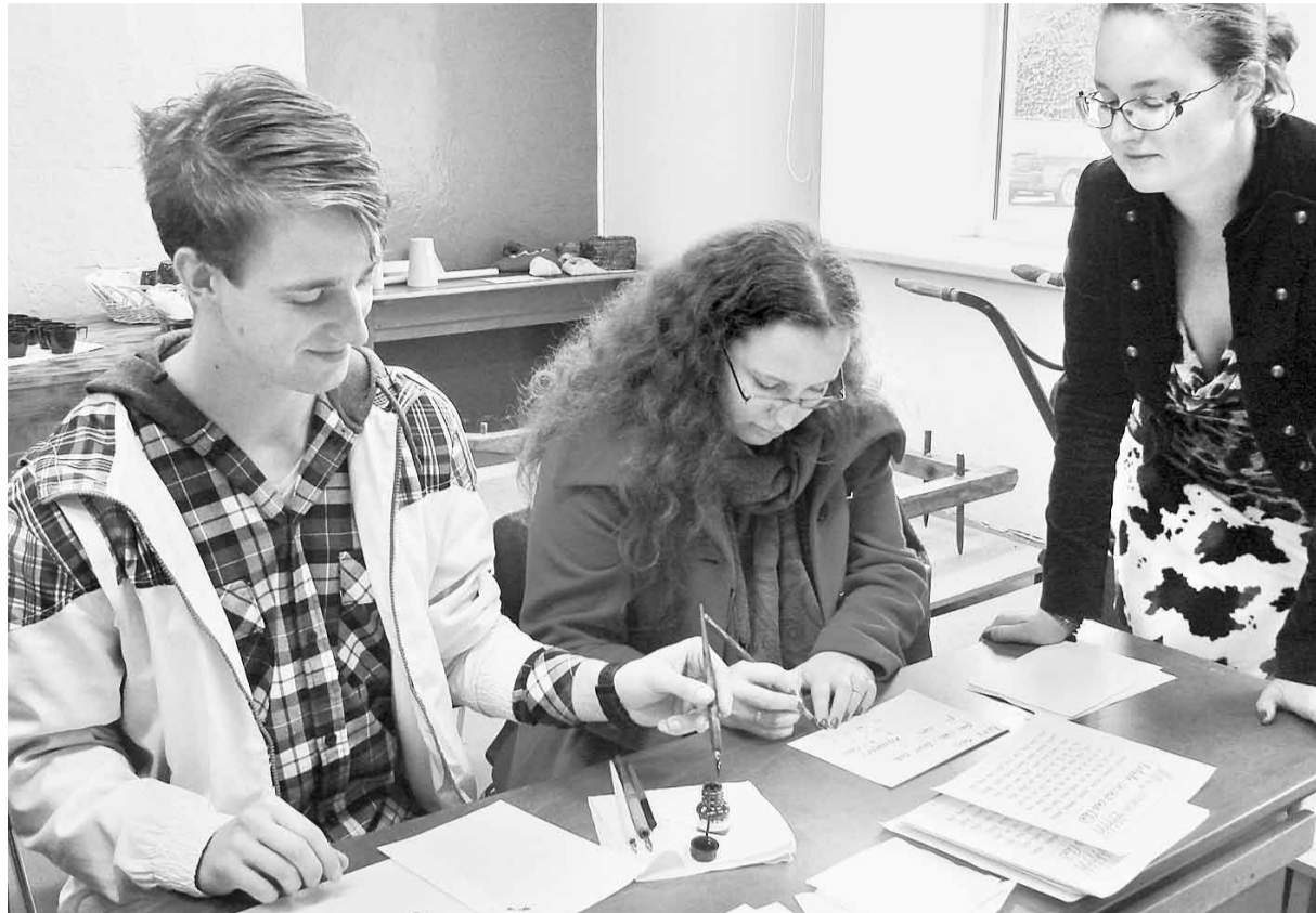
Rūpīgi un nopietni tiek veikts glītrakstīšanas uzdevums.

Lielajā skolas ēkā dienas ieskaņu emocionālu krāsoja Sarkaņu vokālā ansambļa “Rondo” dziedātās dziesmas un izstādē “No Sarkaņu skolas vēstures” vienuviet skatāmais foto klāsts, mācību lietas un informācijas glabātājas – dienasgrāmatas, albumi, avīze “Skurstenis”. Ikvienam te bija iespēja izstaigāt un apskatīt Madonas muzeja etnogrāfijas un sadzīves priekšmetu krātuves ar amatnieku rīkiem, istabu iekārtojumu, mēbeļu, sadzīves priekšmetu, mēru un tvertņu kolekcijām, kā arī izciliem kultūras darbiniekiem sarkaniešiem un šīs skolas absolventiem