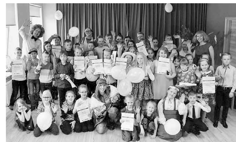
Konkursa “Re, kā ES protu!” dalībnieki.

Simpātiju balvas, 10 eiro dāvanu karti no grāmatnīcas “Glo-