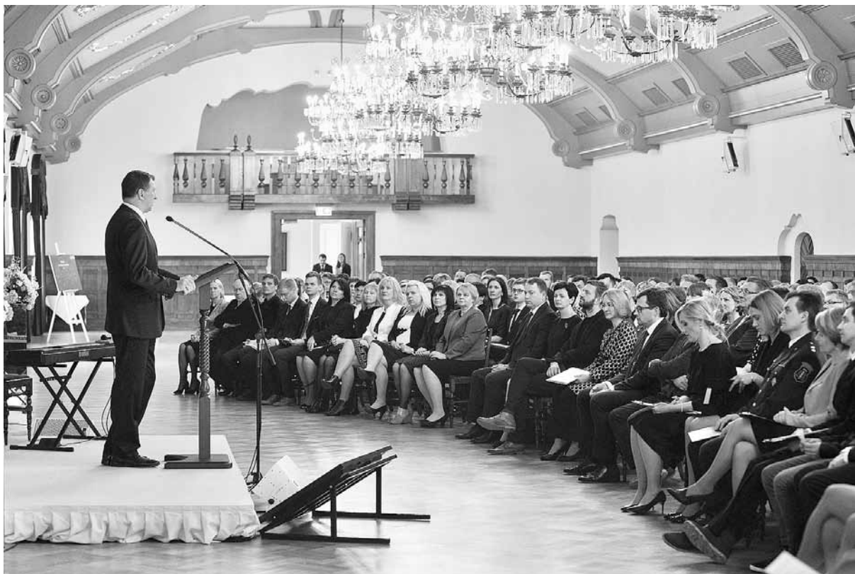
Valsts prezidents, Latvijas valsts simtgades patrons Raimonds Vējonis Rīgas pili uzrunā vairāk nekā 300 simtgades svētku organizatorus no visas Latvijas.

Arī Madonas novads ir sācis ceļu uz svētkiem. Darbu uzsākusi darba grupa, kas šobrīd apzina konkrētas idejas un ieceres, lai svētku pasākumi un norises būtu pārdomāti un dažādi, aptverot visu novada teritoriju. Tiem nav jābūt grandioziem pasākumiem ar vairākiem simtiem un tūkstošiem apmeklētāju. Tas var būt kāds piemiņas pasākums slavenam novadniekam vai sakopšanas talka kultūrvēsturiskā objektā. Noteikti jāuzklausa un jāņem vērā sabiedrības domas vai idejas, jo viena no galvenajām svētku radošās koncepcijas un komunikācijas sastāvdaļām ir cilvēks, kas