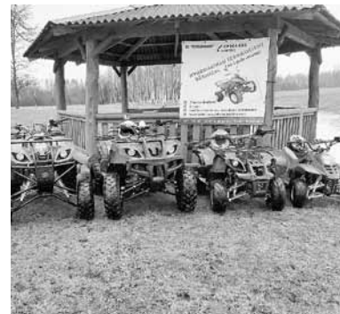
Kvadraciklu noma bērniem “Strautniekos” Aronas pagastā.

Atklājot aktīvo tūrisma sezonu arī šogad “Lauku ceļotājs” rīkos akciju “Atvērtās dienas laukos