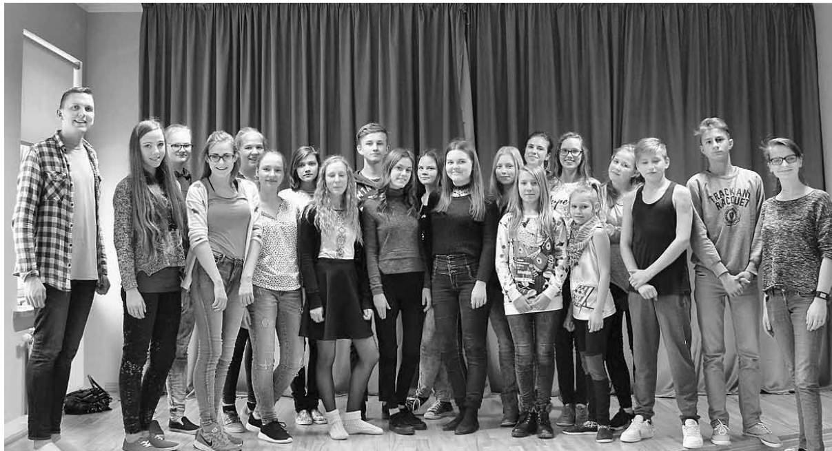
Apmācību dalībnieki – aktīvākie skolu jaunieši no Madonas novada.

Mācības tika atklātas ar iepazīšanās spēli “Stāstu stāstiem”. Tā kā apmācības ir neformālā izglītība, darbošanās notika brīvā atmosfērā, kustoties un komunicējot vienam ar otru. Dienas gaitā tika izlozēts viens cilvēks no klātesošajiem, kam palīdzēt un iedrošināt visa gada garumā veikt plānotos darbus, kas tika