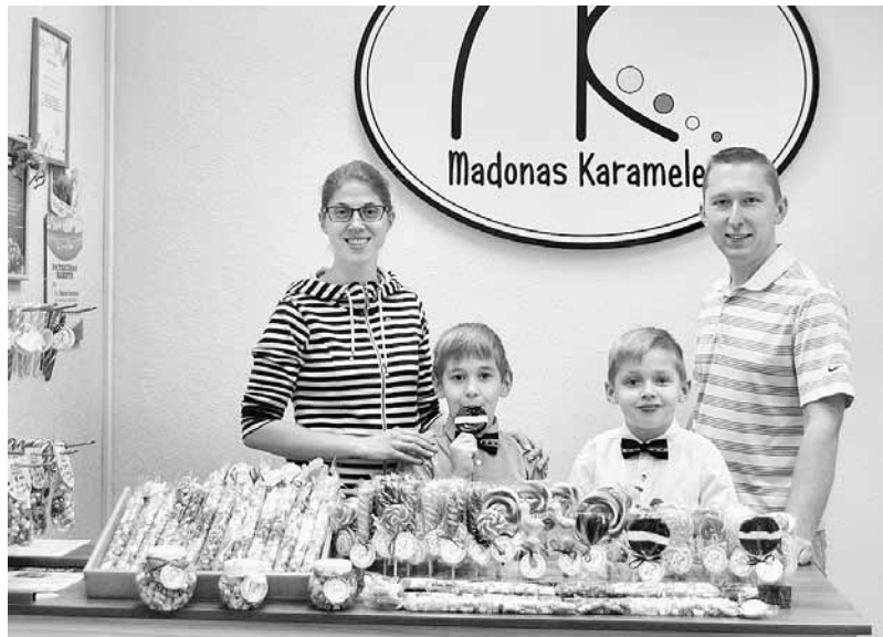
Madonas karameļu ražotne un darbnīca.