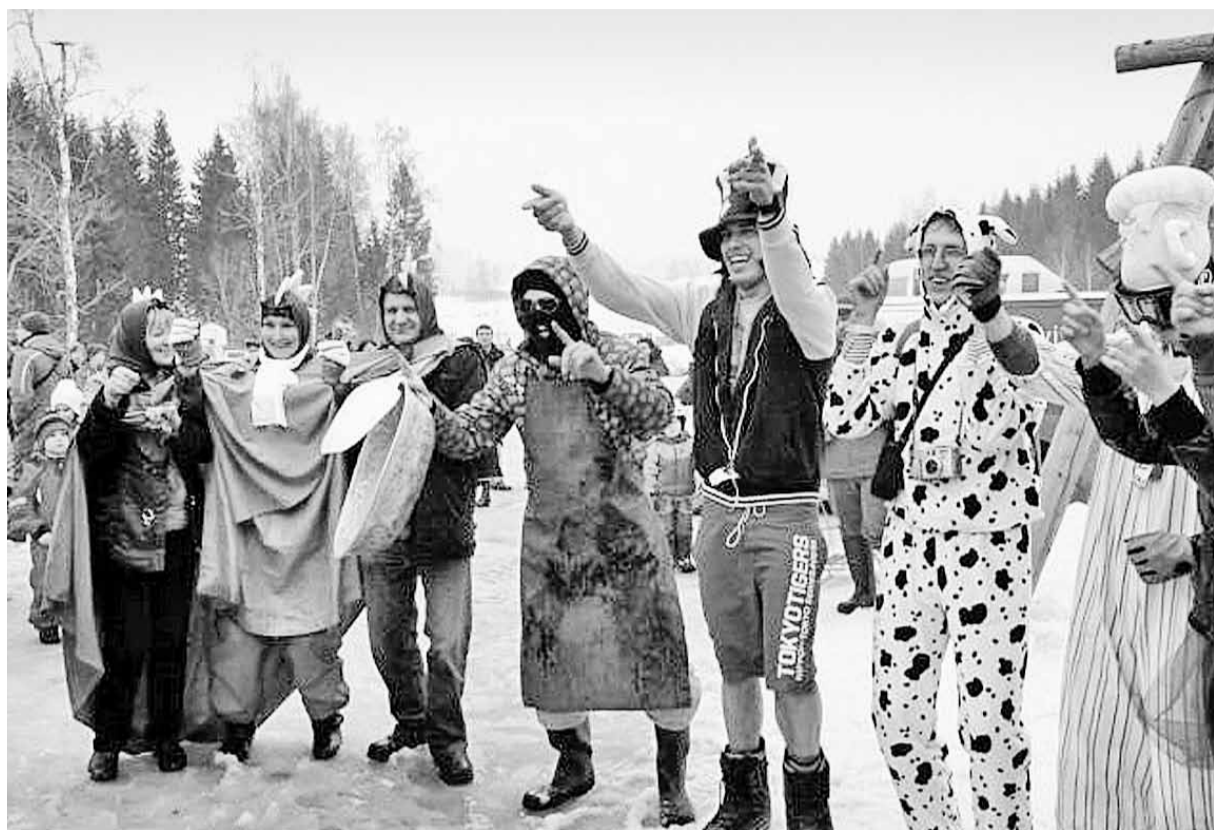
Gaiziņkalna karnevāla dalībnieki.