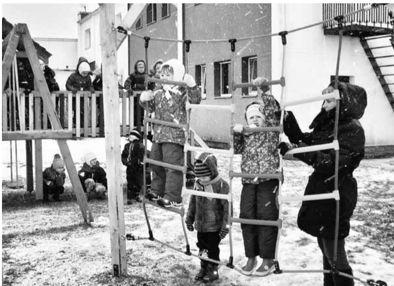
Bērnu prieks par spēļu laukumiņu ir acīmredzams.

2. Hipotēku bankas klientu kluba „Mēs paši” atbalstīto projektu „Staro kustībā”, kura mērķis bija izveidot Praulienas pagasta ģimenēm bērnu rotaļu