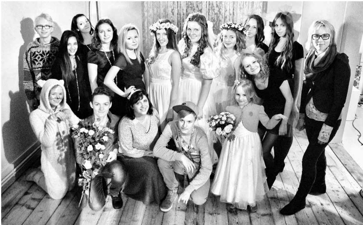
J. Simsona Madonas mākslas skolas 5. kurss.

11.00 – 13.00 Skolu prezentācijas Madonas kinoteātri „VIDZEME” 13.00 – 14.00 Pusdienas 14.00 – 16.00 Latvijas modes mākslinieku un dizaineru piederzes stāsti „TĒLA ARHITEKTŪRA” 17.00 Modes skate – konkurss „KARALISKĀ ROZE” Madonas kultūras namā