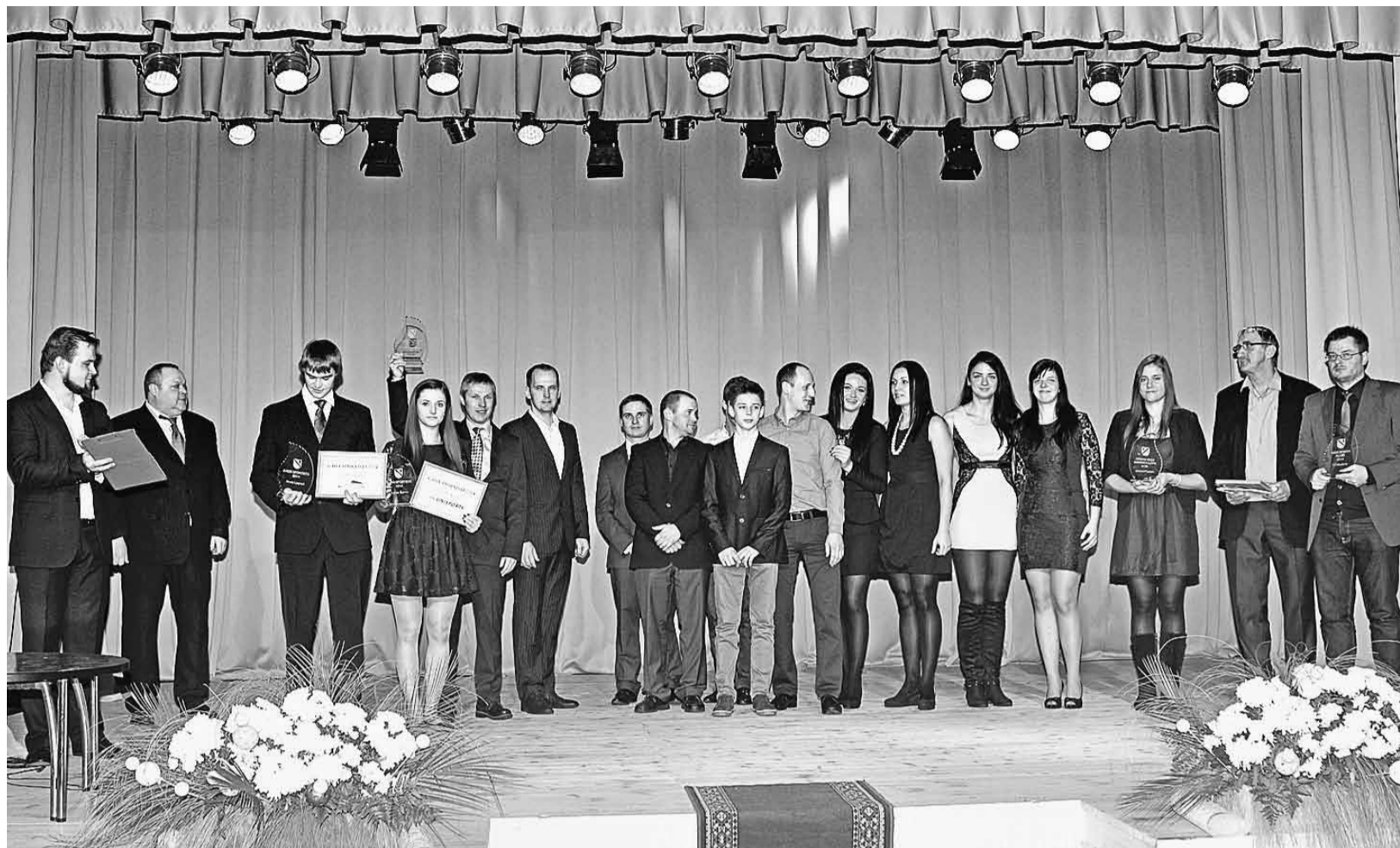
Visi interneta balsojuma "Gada balva sportā 2014" uzvarētāji.