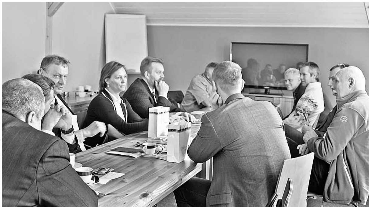
Sanāksmes dalībnieki meklēja risinājumu sporta internāta izveidei Smeceres sila sporta un atpūtas bāzē.