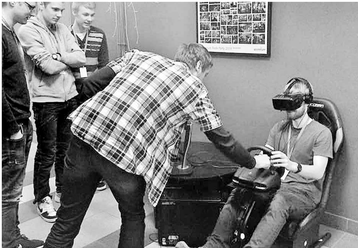
Madonas novada programmēšanas studenti izmēģina virtuālās realitātes iespējas.

Programmētājs ir viena no tām profesijām, kur darba tirgū pieprasījums krietni pārsniedz piedāvājumu. Tas nozīmē, ka cil-