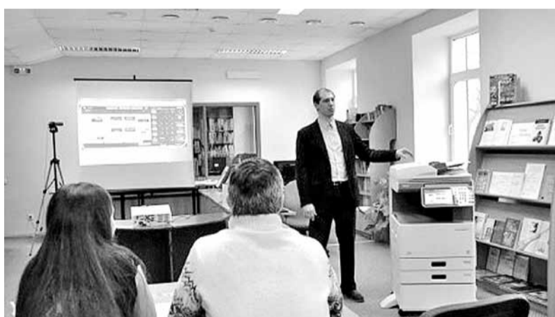
Projekta dalībnieki apgūst jauno tehnoloģiju iespējas Madonas novada bibliotēkā.

Projekta realizācijas gaitā izveidotas 14 jaunas publiski pieejamas bezvadu interneta zonas 6 bērnu jauniešu centros: Madonas Bērnu un jauniešu centrā, Madonas multifunkcionālajā jaunatnes iniciatīvu centrā “Kubs”, Madonas jauniešu iniciatīvas centrā “Burbulis”, Kals-