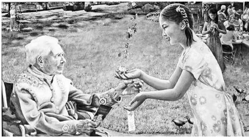
Ilustrācija no izstādes.

No 2015. gada 24. aprīļa līdz 31. maijam Madonas novadpētniecības un mākslas muzeja Izstāžu zālēs, Skolas ielā 10a, Madonā, notiks starptautiska mākslas izstāde „Īstenība, Labestība, Pacietība mākslā” (Džen-Šan-Žen mākslā), kura stāstīs par labo un jauno, par cilvēka garīgās pasaules skaistumu un par cilvēktiesību pārkāpumu tragēdiju.