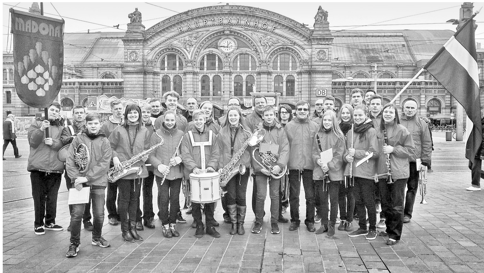
Orķestra dalībnieku foto no Brēmenes.