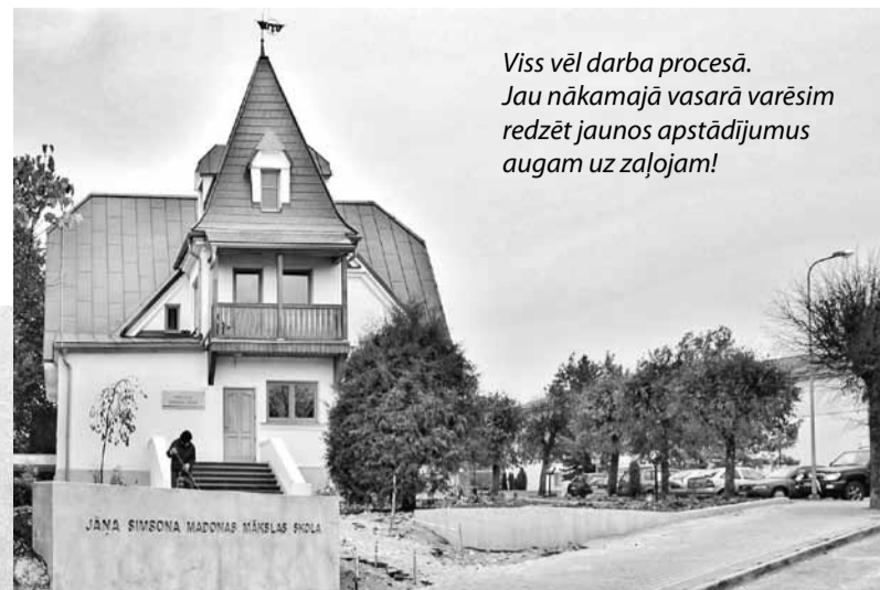
Viss vēl darba procesā. Jau nākamajā vasarā varēsīm redzēt jaunus apstādījumus augam uz zaļojam!

Turpinām darbu pie programmas sakārtošanas pārejai no 5 uz 7 gadu mācību programmu. Tas nozīmē, ka bērni ar mākslas