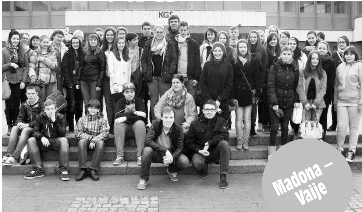
Madonas delegācijas jaunieši kopā ar vācu draugiem.