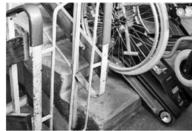
Kāpurķēžu pacelājs darbībā.

Lai trepes vairs nebūtu šķērslis pārvietoties