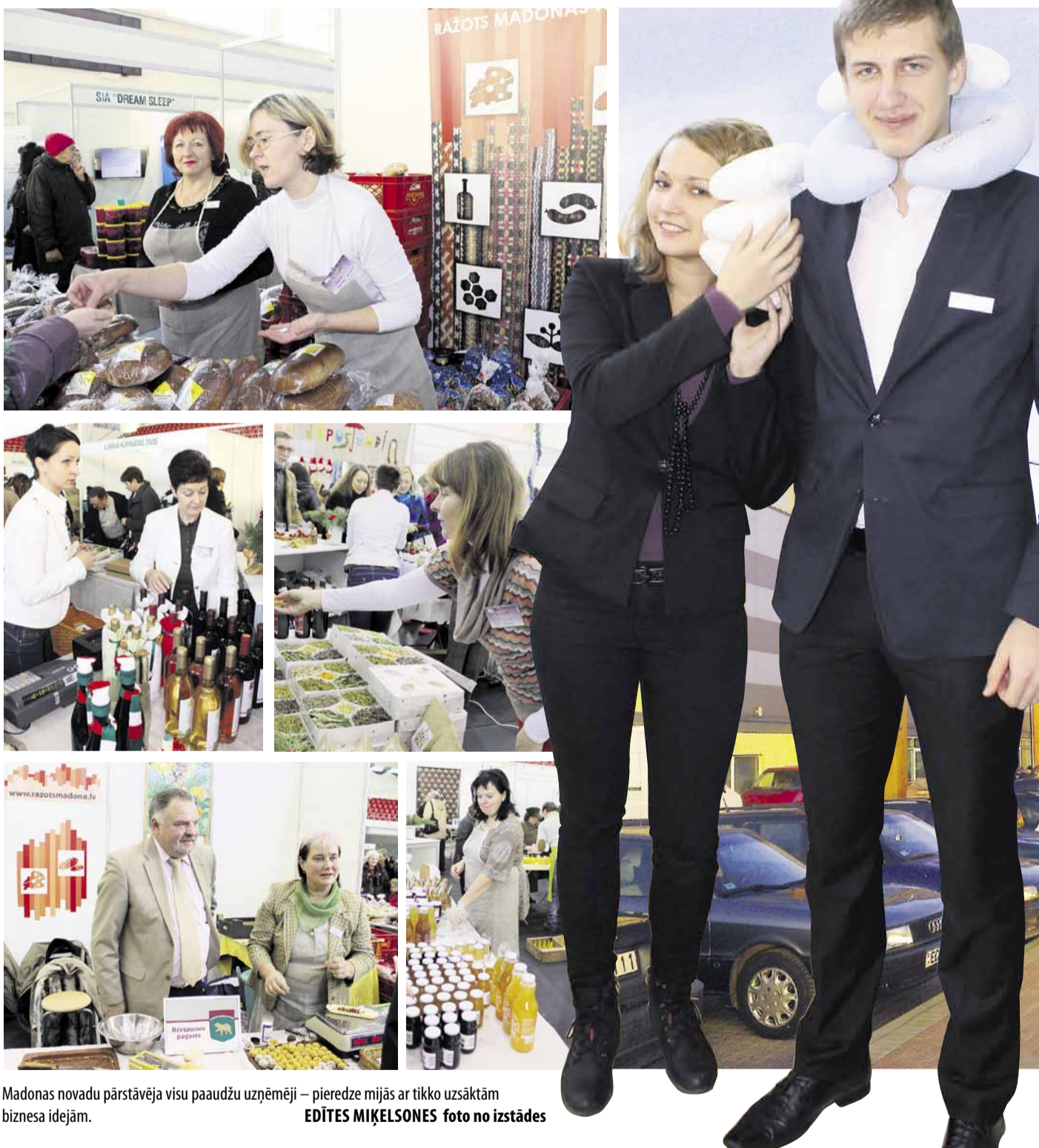
Madonas novadu pārstāvēja visu paaudžu uzņēmēji – pieredze mijās ar tikko uzsāktām biznesa idejām.