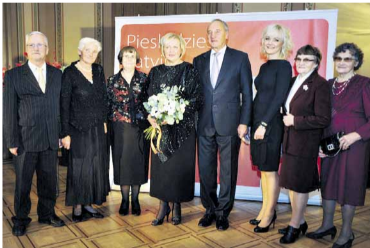
Madonas novada dalībnieki projekta “Pieslēdzies Latvija” noslēgumā ar Valsts prezidentu Andri Bērziņu.

Šajā projektā seniori apguva iemaņas darbā ar datoru un internetu – sākot no datora ieslēgšanas līdz pat informācijas meklēšanai internetā, e-pasta lietošanu un komunikāciju internetā ar Skype, citu sociālo tīklu lietošanu un biznesa skolu senioriem. Katrs dalībnieks saņēma mācību grāmatu,