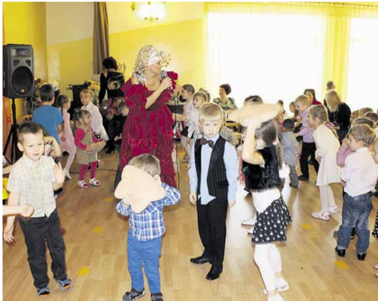
Jubilejas reizē rotaļās labprāt piedalījās visi mazie audzēkņi.

Rakstām un iesaistāmies dažādos projektos. Bijām to divpadsmit Latvijas pirmsskolas izglītības iestāžu vidū, kas izcīnīja tiesības piedalīties „Sešgadīgo izglītojamo mācību programmas ieviešanas aprobācijā”. Rezultātā ieguvām plašu metodisko mācību līdzekļu klāstu apmācībai no valsts finansējuma, kā arī interaktīvo tafeļu un elektroniskos mācību materiālus sešgadīgo bērnu apmācībai. Šogad piedalījāmies Madonas novada Izglītības projektu konkur-