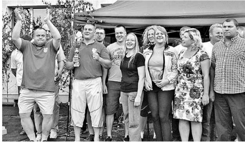
Uzvarētāju prieks. Nākamgad spēļu organizēšana jāuzņemas madoniešiem.

Norisinājās arī vadītāju sacensības. Pārvalžu vadītāji sacentās