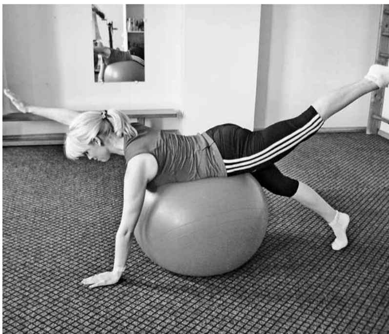
Nodarbības tiek apgūta individuāla vingrojumu programma, ko viegli var izpildīt mājās apstākļos.

Fizioterapeits savu darbību var uzsākt vēl pirms cilvēks nāk