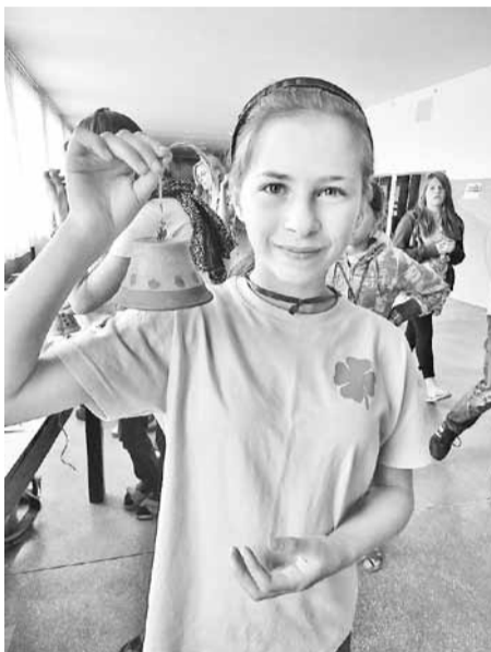
Ļaudonas mazpulka meitene ar pašgatavoto zvanu.

Latvijas Mazpulku projekts „Visu daru es ar prieku!” (līguma identifikācijas Nr. 2010.CH04/mac – 105/10).