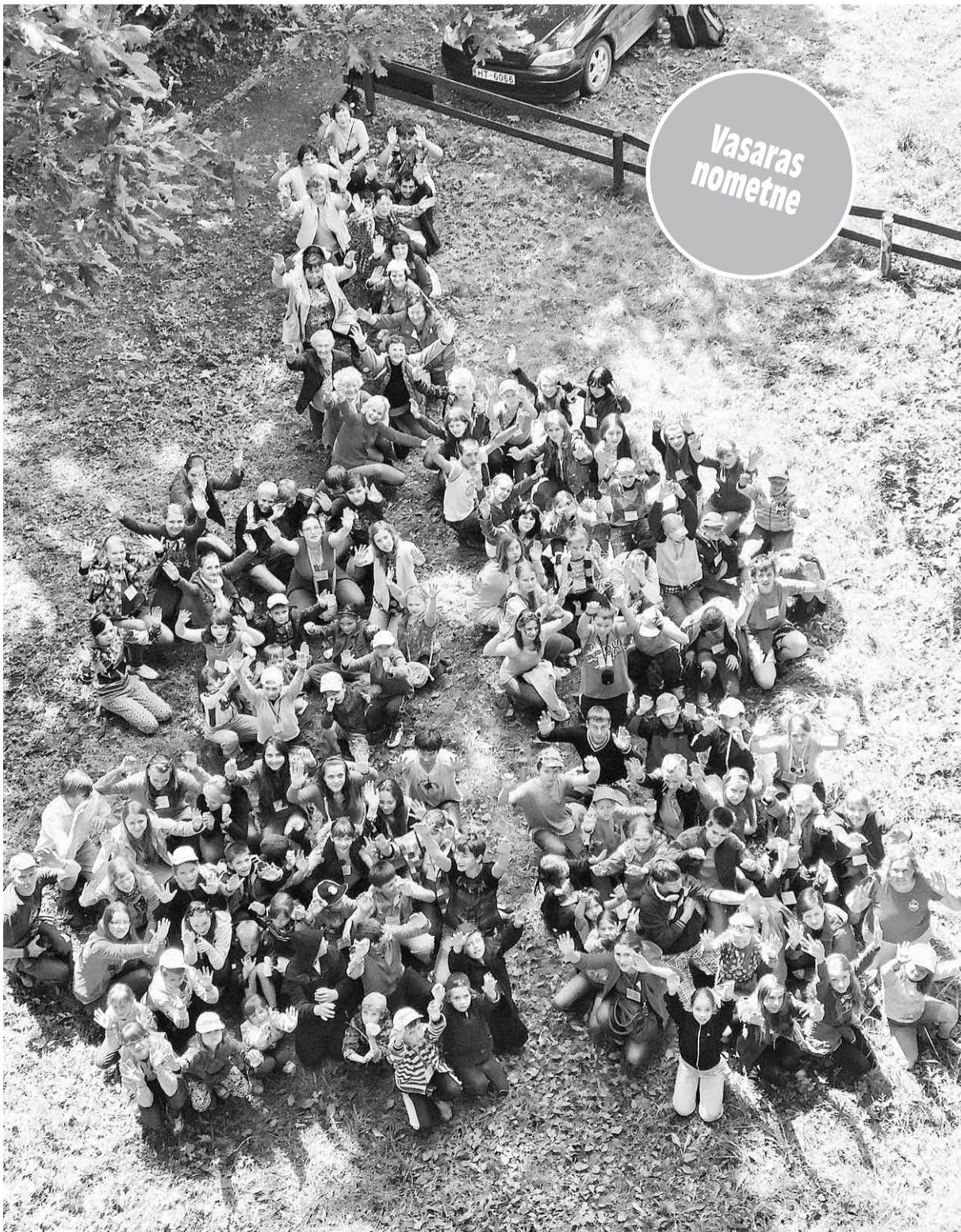
Visi nometnes dalībnieki kopbildē, izveidojot Mazpulku simbolu – āboliņa lapu.