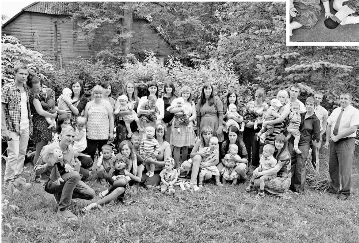
Kalsnavas pagasta nākotne – jaunie vecāki ar savām atvasēm.