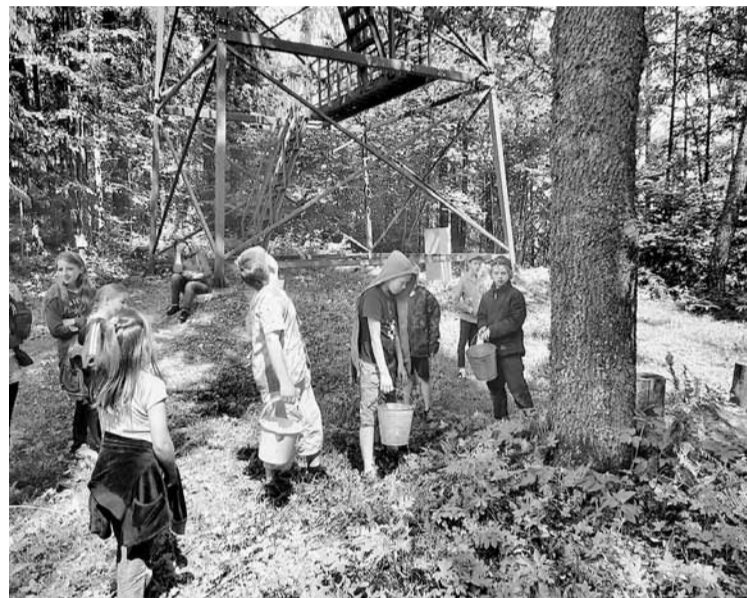
Krustkalnu rezervātā no Plencīša ezera tiek atnests ūdens, lai aplaistītu Kārļa Ulmaņa stādīto ozolu – simboliski pieminot, kā to darījis Kārļa Ulmanis.