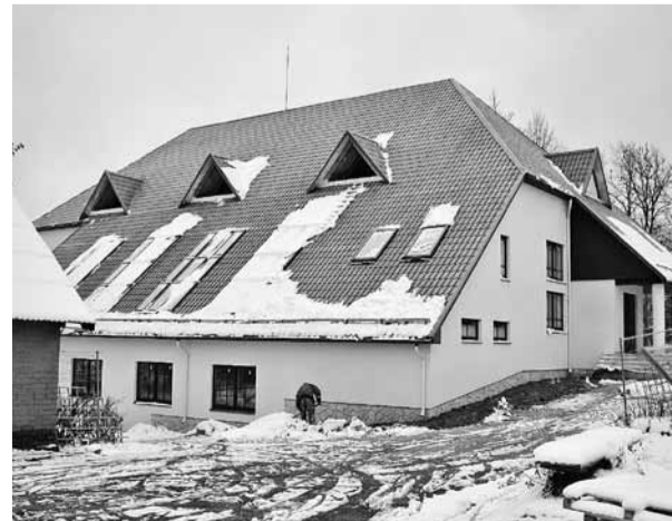
Būvdarbu laikā 2012. gada oktobrī.

Madonas novada pašvaldības Projektu sagatavošanas un ieviešanas speciāliste