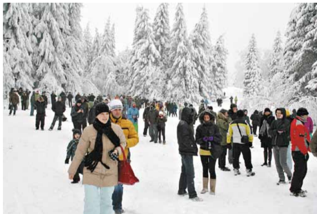
Ap tūkstoš skatītāju vēroja torņa spridzināšanas brīdi.