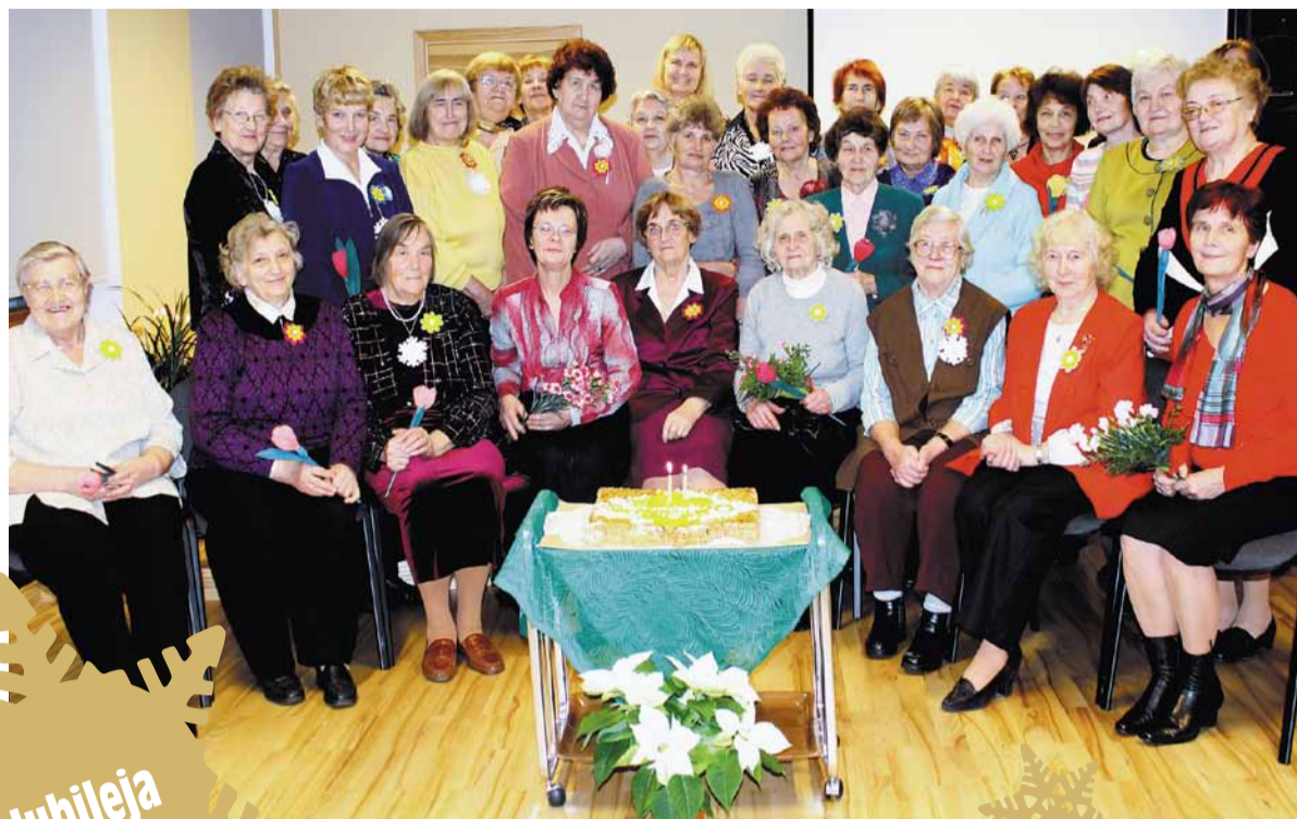
Klubiņa pašreizējās dalībnieces jubilejas reizē.

Nāk svētki, un mēs arvien biežāk domājam par dāvanām. Klubiņa dalībnieces uzskata, ka ne jau viss ir izmērāms naudā,