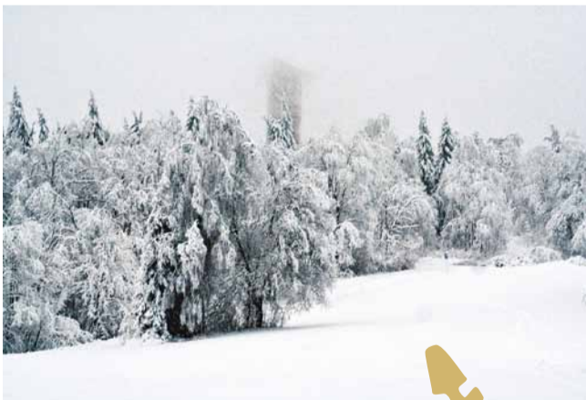
Brūkošā Gaiziņkalna torņa pēdējās sekundes.