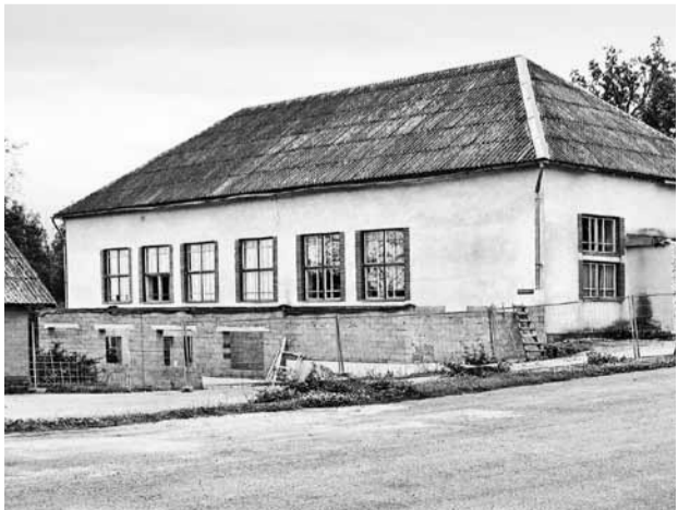
Uzsākot būvdarbus, 2012. gada jūlijā.

Rekonstruējot tautas namu, ir uzbūvēta piebūve pie esošā tautas nama, iegūstot papildus telpu pie skatītāju zāles. Piebūvē tiks izveidota garderobe, kā arī tualetes apmeklētājiem. Tautas nama rekonstrukcijas ietvaros