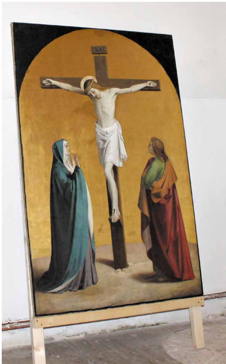
Altārglezna „Kristus pie Krusta”.