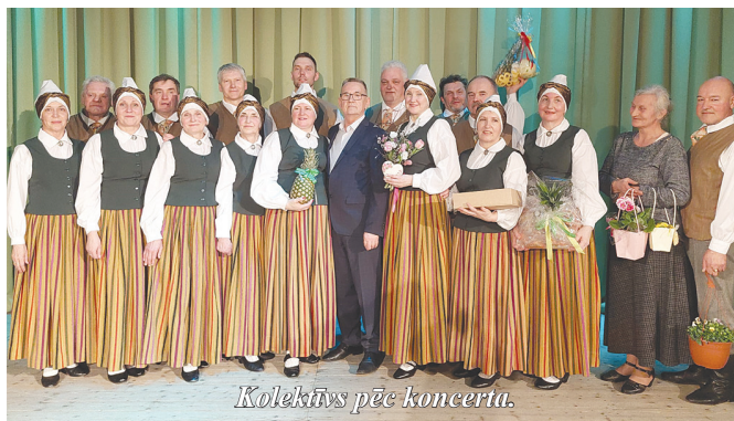
Kolektīvs pēc koncertu.