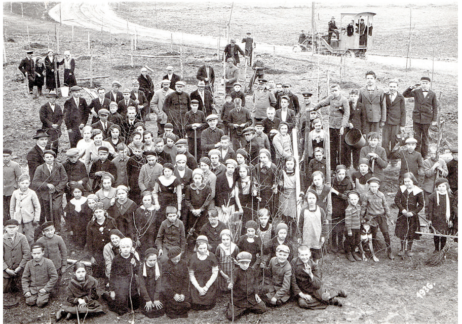
Meža dienās skolēni Sarkanu pagastā. 1936. gads. (Foto aizmugurē mūsdienās ar lodīšu pildspalvu uzrakstīts “Citos avotos – 1932. gads. Mežu dienas Sarkanu pamatskolā”.)