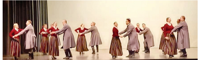
VPK "Kalnagravas" uz Valmieras kultūras centra skatuves.

Paldies vadītājai par uzdrīkstēšanos un kolektīvam par ieguldīto darbu, enerģiju un jaunu pieredzi kopā!