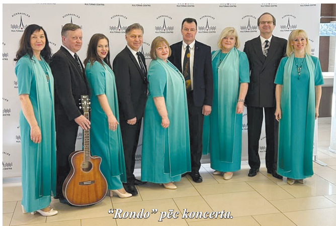
"Rondo" pēc koncertu.

2. martā jauktais vokālais ansamblis "Rondo" piedalījās koncertā "Cimos nāc!" Aizkraukles kultūras centrā.