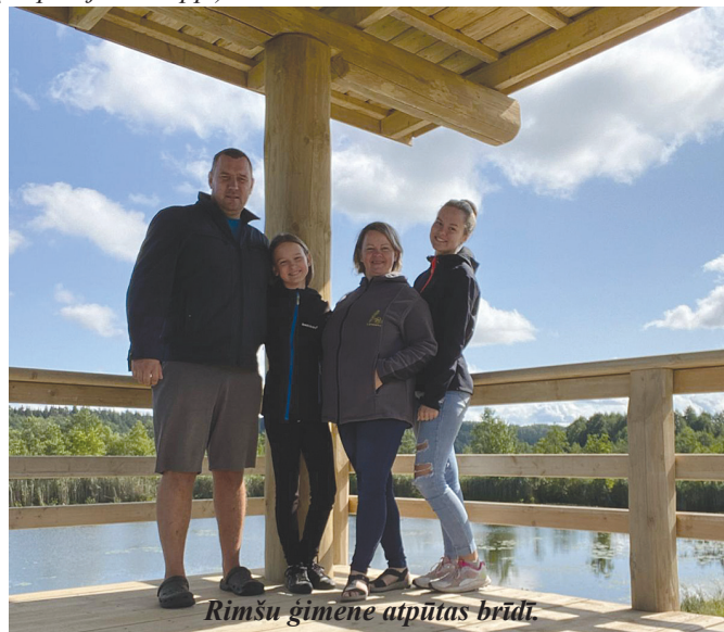
Rimšu ģimene atpūtas brīdī.