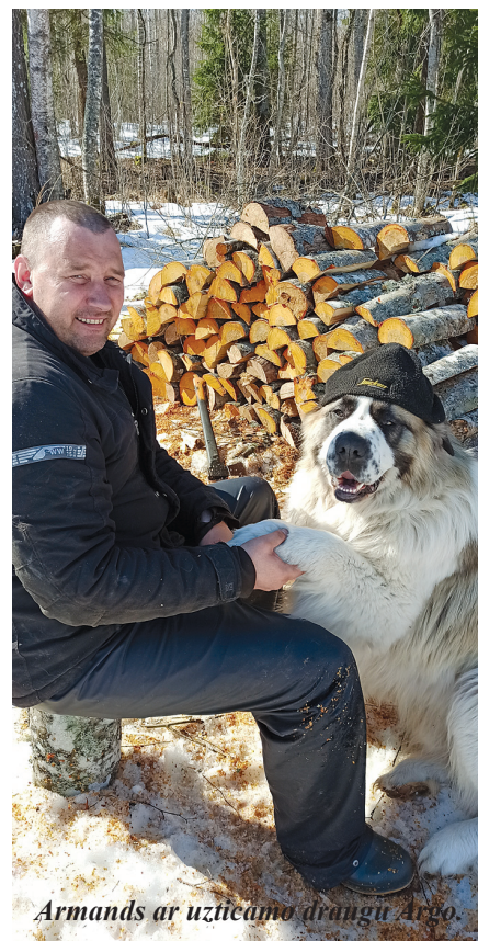
Armands ar uzteicamo drangu Argo.