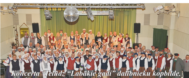
Koncerta "Ielūdz "Labākie gadi"" dalībnieku kopbilde.