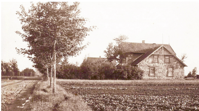
Sarkaņu skolas abas ēkas, fotografētas no pagastmājas puses. 1924. gads.