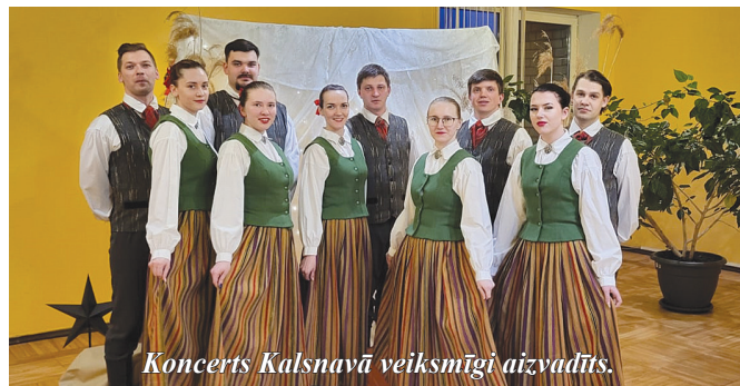
Koncerts Kalsnavā veiksmīgi aizvadīts.

23. martā kolektīvs, ko iepriekš pazinām kā JDK "Resgaļi", Kalsnavā piedalījās deju kolektīvu sadancī "Duni dejā!". Koncertā viņi piedalījās ar nosaukumu "Ramoste". Nosaukuma maiņa saistīta ar grupas maiņu, kurā kolektīva dalībnieki turpmāk nolēmuši startēt, un nosaukums radies no vēsturiskiem datiem. Sarkaņu zemes senais nosaukums, kas lietots pirms 13. gadsimta bija "Ramoste". Lai kolektīva dalībniekiem raits dejas solis un veiksmē turpmāk!