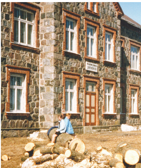
Pēc ēkai tuvāko divu koku nozāģēšanas. 1996. gada 15. aprīlis.

Sarkaņu skolas apstādījumi ēku 120 gadu pastāvēšanas laikā mainījušies, kaut tāpēc vien, ka koki un krūmi aug, noveco vai tos skar citas apkārtnē viešamas iz-