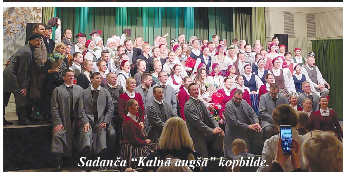
Sadanča "Kalnā augšā" kopbilde.

2. martā jauktais vokālais ansamblis "Rondo" piedalījās koncertā "Cimos nāc!" Aizkraukles kultūras centrā.