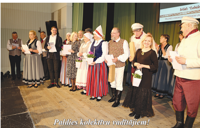
Paldies kolektīvu vadītājiem!