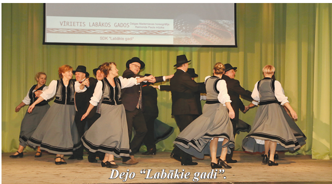
Dejo "Labākie gadi".

20. janvārī deju kolektīvs "Labākie gadi" "Kalnagravās" uz koncertu bija aicinājis tuvākus un tālākus dejas draugus. Sadancī "Ielūdz "Labākie gadi"" piedalījās deju kolektīvi: "Ogrēnietis" (Ogre), "Baltābele" (Garkalne), "Vērdiņš" (Gulbene), "Atbalss" (Daugavpils), "Tacis" (Carnikava), "Labāko gadu Virši" (Inčukalns), un "Kūmiņš" (Varakļāni).