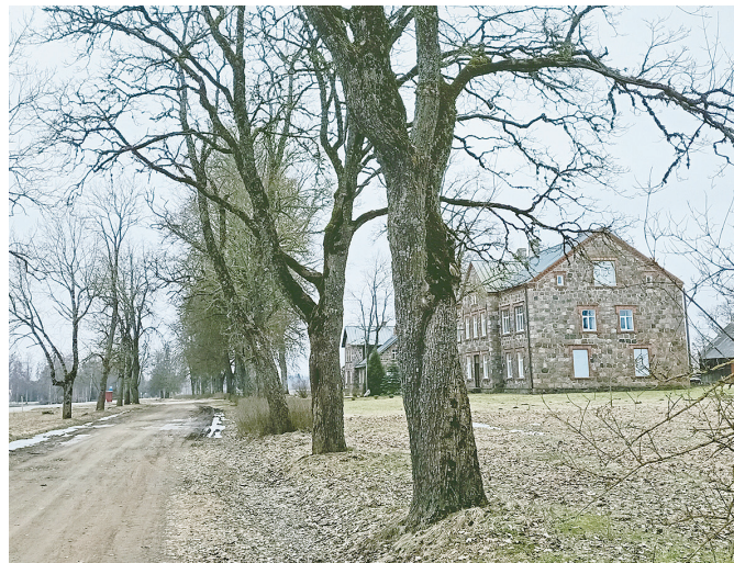
Ošu-liepu gatve gar veco ceļu. 2024. gada 13. martā.