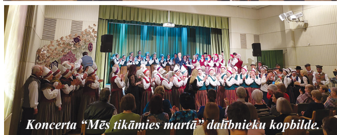
Koncerta "Mēs tikāties martā" dalībnieku kopbilde.

23. martā kolektīvs, ko iepriekš pazinām kā JDK "Resgaļi", Kalsnavā piedalījās deju kolektīvu sadancī "Duni dejā!". Koncertā viņi piedalījās ar nosaukumu "Ramoste". Nosaukuma maiņa saistīta ar grupas maiņu, kurā kolektīva dalībnieki turpmāk nolēmuši startēt, un nosaukums radies no vēsturiskiem datiem. Sarkaņu zemes senais nosaukums, kas lietots pirms 13. gadsimta bija "Ramoste". Lai kolektīva dalībniekiem raits dejas solis un veiksmē turpmāk!