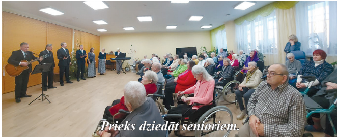
Prieks dziedāt senioriem.

priecēja SAC "Jaungulbenes Alejas" iemītniekus.