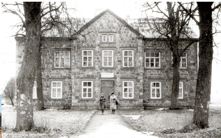
Liepas ēkas parādes pusē. 1980. gadu sākums.

Labi tās abas redzamas 1980. gadu pirmajā pusē uzņemtajā foto. Ar gadiem koki radīja aizēnojumu klašu telpām un