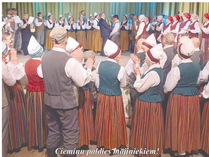
Ciemiņu paldies mājiniem!