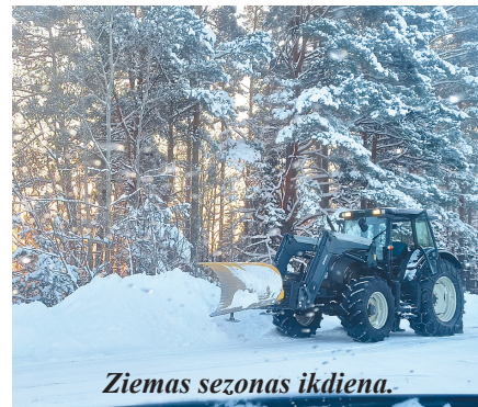
Ziemas sezonas ikdiena.