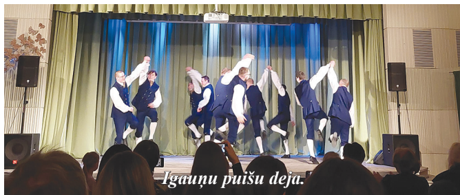
Igauņu puīšu deja.

braukuši deju kolektīvi no visdažādākajām Latvijas vietām. Mūsmājās šinī gadā ciemojās JDK "Mārupe", DK "Kursa" (Saldus), VPK "Pūces" (Dzelzava), VPK "Sunta" (Suntaži) un VPK "Sen Līgo" (Rīga). Koncerta laikā visskanīgākos aplausus ar lūgumu deju atkārtot izpelnījās igauņu deja "Kalnagravu" puīšu izpildījumā. Pasākums noritēja Valentīndienas noskaņās gan koncerta, gan kolektīvu atpūtas vakara daļā.