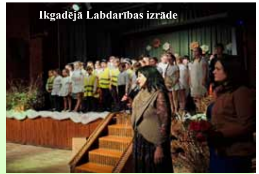
Ikgadējā Labdarības izrāde