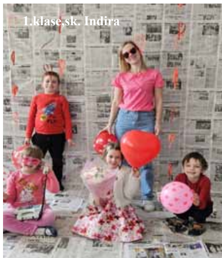
1.klase, sk. Indīra