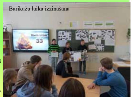
Barikāžu laika izzināšana