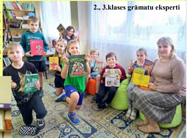
2., 3.klases grāmatu eksperti

No 2001. gada Latvijā veiksmīgi darbojas lasīšanas veicināšanas programma "Bērnu, jauniešu un vecāku žūrija". Tā ir LR Kultūras ministrijas un Latvijas Nacionālās bibliotēkas finansēta Bērnu literatūras centra iniciatīva, ko raksturo visplašākais aptvērumš. Programma tiek īstenota ikvienā Latvijas novadā un, kopš 2007. gada, tā ir pieejama arī ārpus Latvijas robežām. Katrai vecuma grupai ieteiktās grāmatas lasa un vērtē bērni, jaunieši, no 2012. gada – arī pieaugušie. Tādējādi, rādot priekšzīmi bērniem, par žūrijas ekspertiem ir kļuvuši daudzi vecāki, vecvecāki un skolotāji.