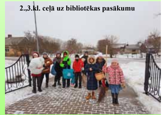
2.,3.kl. ceļā uz bibliotēkas pasākumu