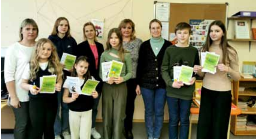
Foto mirklis ar Skatuves runas konkursa dalībniekiem un pedagogiem.

Programmas mērķis ir veicināt lasītprasmi un interesi par grāmatām, vienot lasītājus un rosināt diskusijas par grāmatām, sekmēt augstvērtīgas literatūras izplatību. Bibliotēkās, kas pieteikušās dalībai programmā, nonāk aktuālāko grāmatu kolekcija. Kolekcijā ir pieredzējušu un profesionālu bērnu un jauniešu literatūras ekspertu ieteiktas grāmatas. Līdz janvāra beigām dalībnieki izlasa vismaz trīs izvēlētās vecuma grupas grāmatas un aizpilda elektronisko grāmatu novērtēšanas anketu. Pēc anketas aizpildīšanas viņi saņem balviņu. Aizpildīto anketu rezultāti tiek apkopoti Latvijas Nacionālās bib-