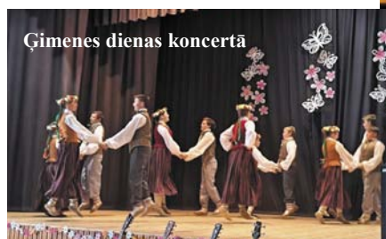
Ģimenes dienas koncertā