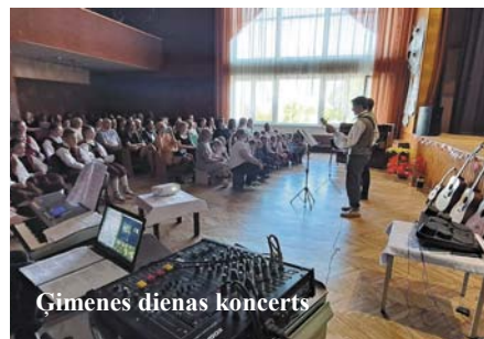
Ģimenes dienas koncerts