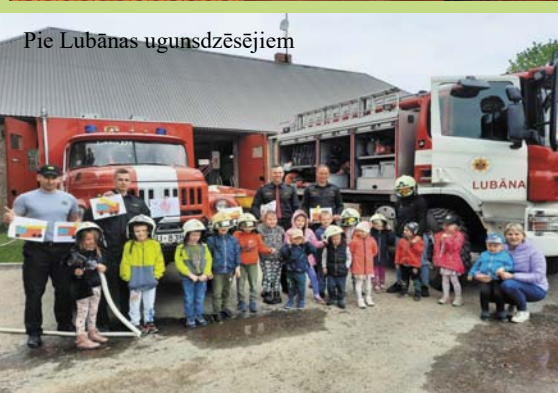
Pie Lubānas ugunsdzēsējiem