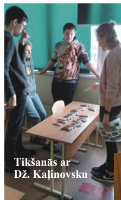
Tikšanās ar Dž. Kaļinovsku