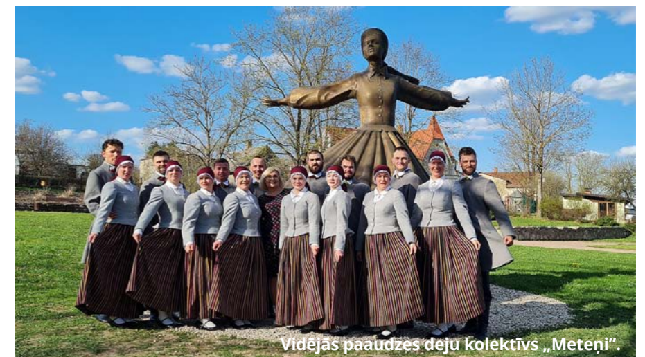
Vidējās paaudzes deju kolektīvs „Meteni”.