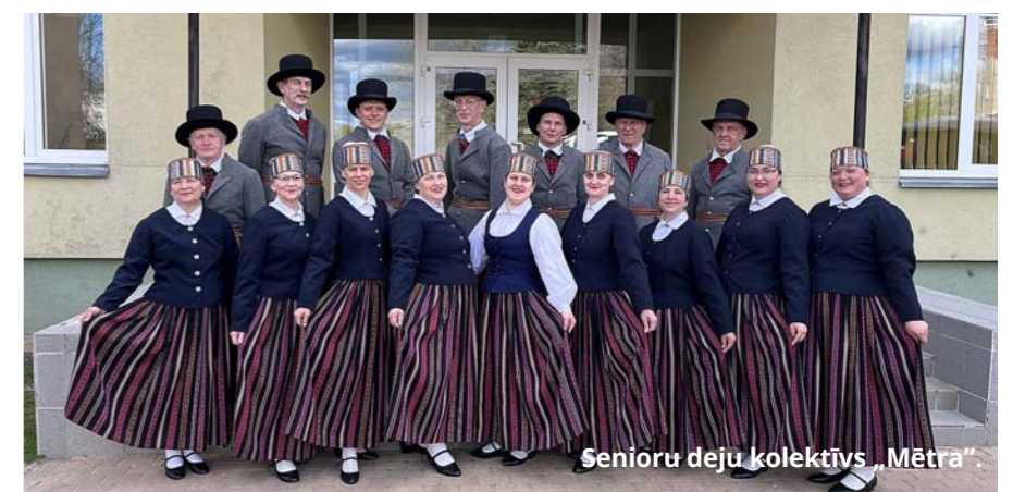
Senioru deju kolektīvs „Mētra”.