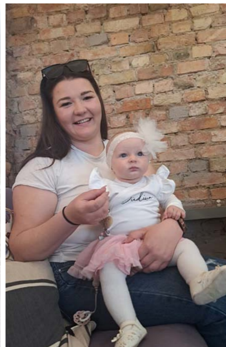
Esmeralda ar ģimeni.