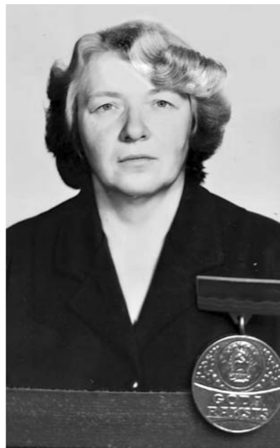
Maija un augstā apbalvojuma medaļa.

10 gadus Jānis atdusas Ozolkalna kapu klusumā.