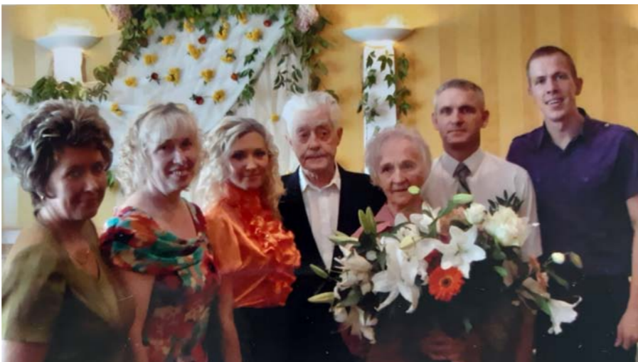
Ausma jubilejā ar saviem mīļajiem.