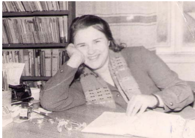
Tas skaistais jaunības laiks!