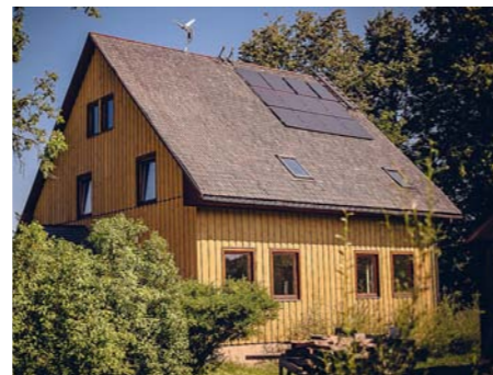
Energiefektivitātes uzlabošana – saules bateriju uzstādīšana.

atbalsta centra ekonomikas nodaļā, kas atradās Ozolniekos, netālu no Jelgavas. Iesākumā darbojos ar projektu un biznesa plānu sagatavošanu lauksaimniekiem un lauku uzņēmumiem, vēlāk biju atbildīgs par organizācijas starptautisko projektu vadīšanu. Tie bija pirmie gadi Eiropas Savienībā. Ar Latvijas Dabas fondu sadarbība sākās jau strādājot Ozolniekos. Tas bija projekts par pļavu atjaunošanu Engures dabas parkā – līdzēju kārtot dokumentus tehnikas iegādei. Tad sekoja vēl daži kopīgi projekti un arī doma, ka varētu strādāt Dabas fondā. Biju sācis veidot saimniecību, slodze Ozolniekos samazinājās. Un tad saņēmu piedāvājumu – fondā „pieskatīt” lietas, kas saistītas ar lauksaimniecības politiku. Un tā – nu jau vairāk kā 10 gadus darbojos Latvijas Dabas fondā, tiku izvirzīts darbam fonda padomē un nu jau otrreiz esmu ievēlēts par padomes priekšsēdētāju.