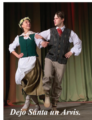
Dejo Santa un Arvis.