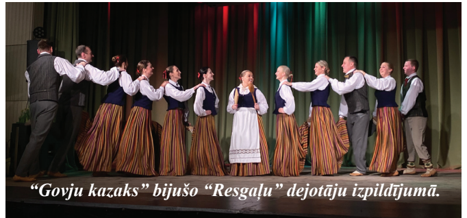
"Govju kazaks" bijušo "Resgaļu" dejojāju izpildījumā.