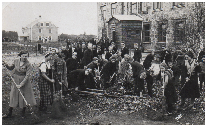
Pie skolas 1930. gadu beigās.