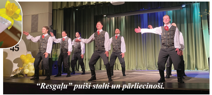
"Resgaļu" puīši stalti un pārlicinoši.