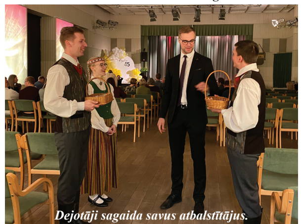
Dejotāji sagaida savus atbalstītājus.