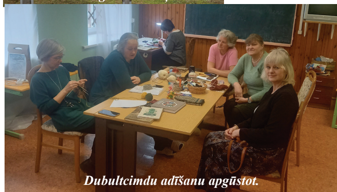
Dubultcimdu adīšanu apgūstot.