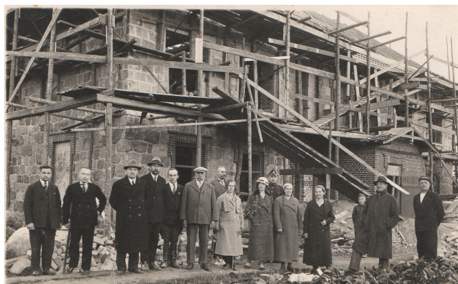
Skola pārbūves laikā 1930. gadu vidū.