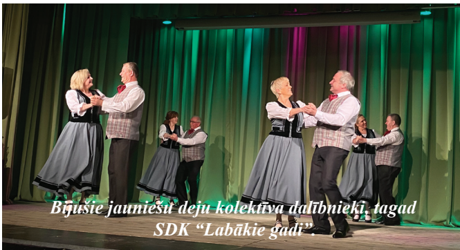
Bijušie jaunieši deju kolektīva dalībnieki, tagad SDK "Labākie gadi".