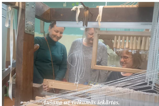
Aušana uz velkamās iekārtas.

Valdas Kļaviņas teksts