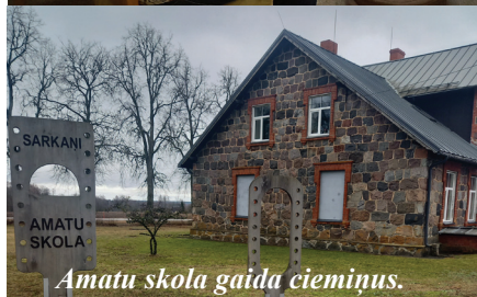
Amatu skola gaida ciemiņus.