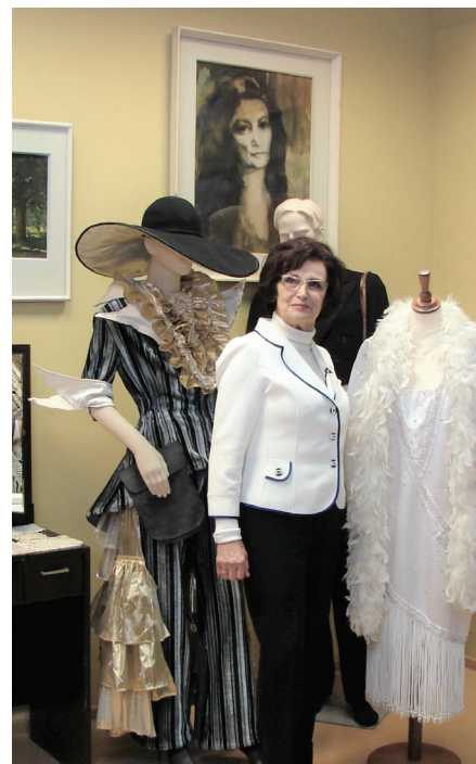
Dokumentālās filmas uzņemšana muzeja ekspozīcijā Sarkanos 2018. gada 15. janvārī.