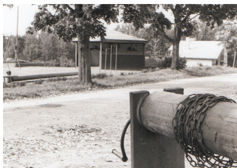
Skolas pagalmā 1980. gados.