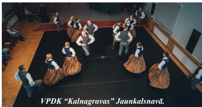
VPDK “Kalnagravas” Jaunkalsnavā.

18. martā deju kolektīvs “Resgaļi” Madonas kultūras namā piedalījās novada deju kolektīvu sadancī, gatavojoties Deju svētkiem.