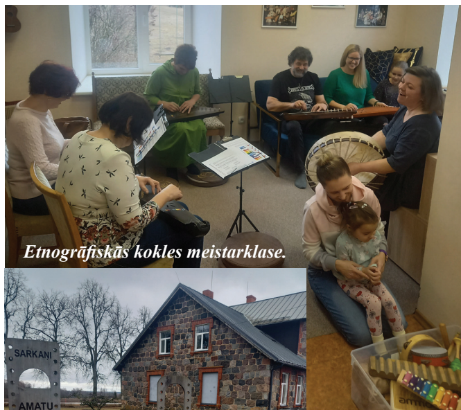
Etnogrāfiskās kokles meistarklase.

Dienas laikā meistarklases Amatu skolā apmeklēja gandrīz 40 interesentu no visdažādākajām Madonas novada vietām un Skrīveriem.