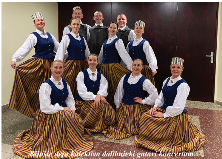
Bijušie deju kolektīva dalībnieki gatavi koncertam.

Valdas Kļaviņas teksts