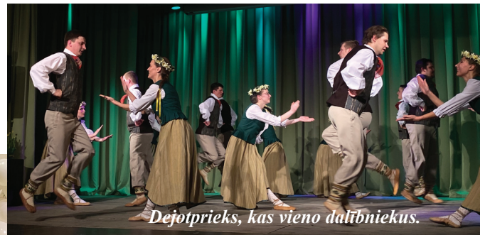
Dejotprieks, kas vieno dalībniekus.