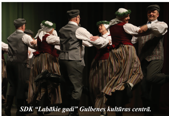
SDK “Labākie gadi” Gulbenes kultūras centrā.

18. martā deju kolektīvs “Labākie gadi” Gulbenes kultūras centrā piedalījās koncertā “Vērdiviņš ripo”.