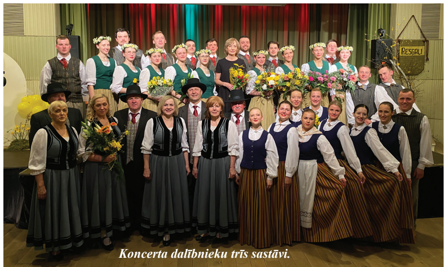
Koncerta dalībnieku trīs sastāvi.