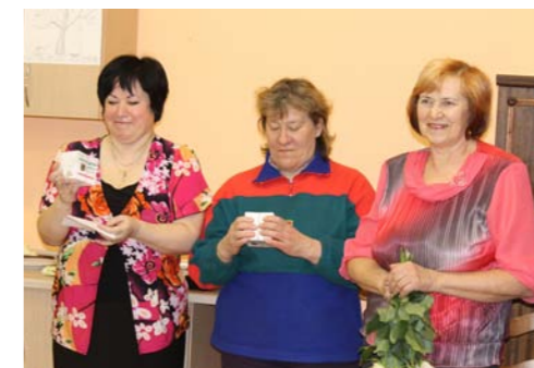
200 numura svētkos.