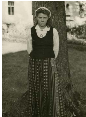
Pie Vestienas skolas izlaiduma dienā.

angļu valodu, vācu laikā – vācu valodu, krievu laikā – krievu un tāpēc beigās neiemācījās nevienu. No bērības visvairāk atmiņā palikuši braucieni ar zirdziņu dziļās ziemas kupenās. Deviņus kilometrus uz skolu – ziemā vajadzēja izbraukt jau tumsā. Mamma satina lielos lakatos un, kad apgāzāmie, paši nevarējām tikt no kupenām ārā. Vēl atmiņā palikusi braukšana Ziemassvētkos no Ļaudonas baznīcas. Uz visiem ceļiem skan pie zirgu lokiem piesietie zvaniņi.