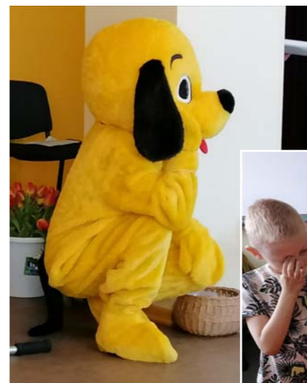
Bija prieks kopā būt!