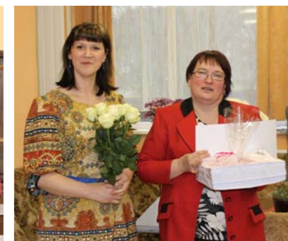
Atvests 200 numurs.