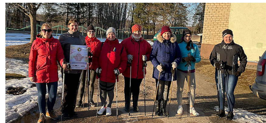
Nūjošanas nodarbības dalībnieki.