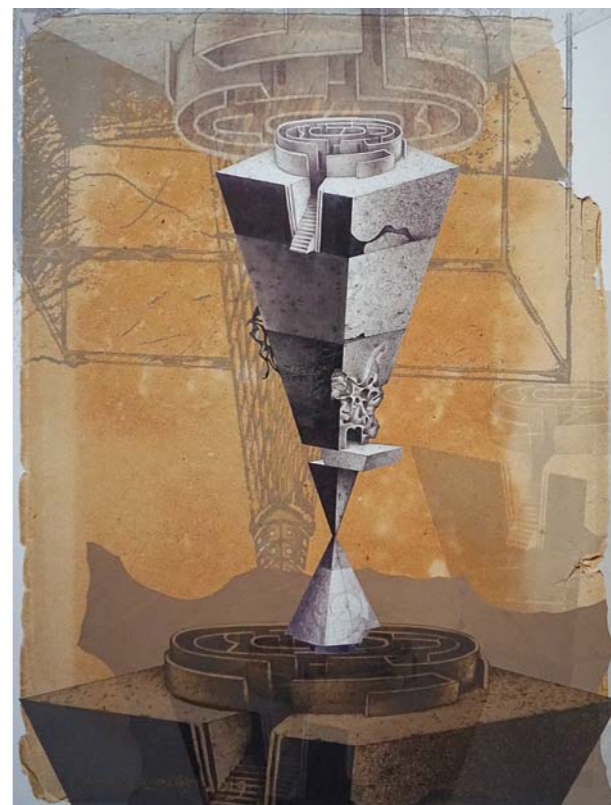
Gunāra Krollja grafika „Reminiscence II”.

Godinot mākslinieku dzīves skaistajā jubilejā, kura iekrīt vasaras saulgriežu svētkos 23. jūnijā, „Madonas muzejnieki sūta Jums mīļus sveicienus! Dienās, kad tik spēcīgi izjūtam dabas dziedinošo spēku, latviskās tra-