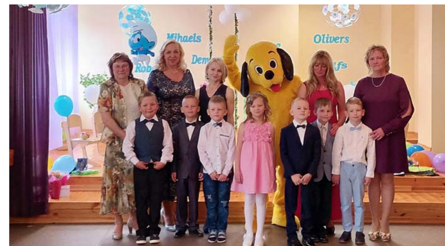
Kopā ar skolotājām un auklītēm,