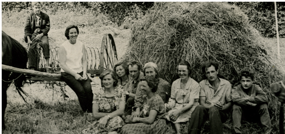
Lauku brigādē 1960-to gadu beigās.