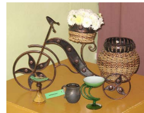
Mētrienas Dzīves iegūtā Spicās Spalvas galvenā balva

Aicinām ikvienu lasītāju dalīties savās domās un atmiņās par izdevumu „Mētrienas Dzīve” 25 gadu laikā!