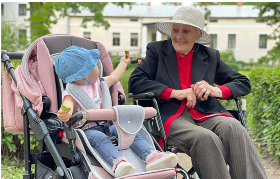
Ruta ar visjaunāko paaudzi 2021. gada 31. jūlijā pie Vestienas skolas.

Pirmā skola bija Saikavas pagasta Kalna skola, kurā mācījās trīs valdību laikā. Latvijas brīvvalsts laikā mācījās