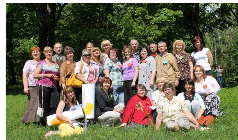
„Mētrienas Dzīves” redkolēģija kopā ar pārējo avīžu veidotājiem Gaiziņkalnē 2013. gadā.