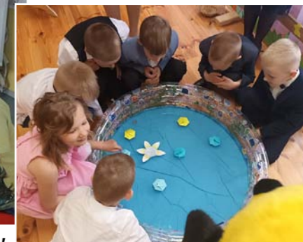
Zīlēšana, ko nesīs mums vasara...