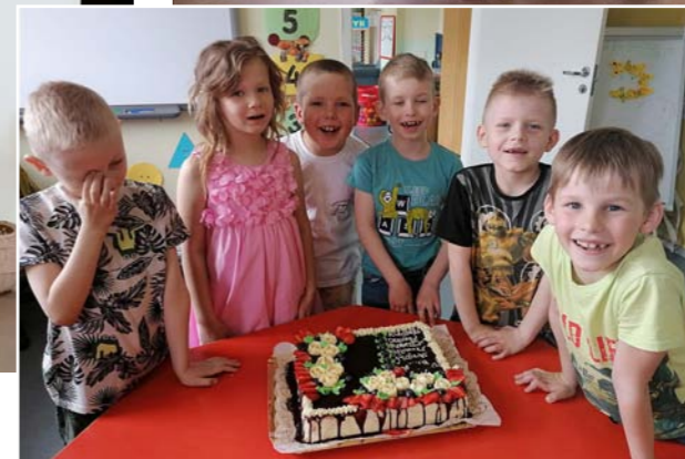
Pie lielās svētku tortes!