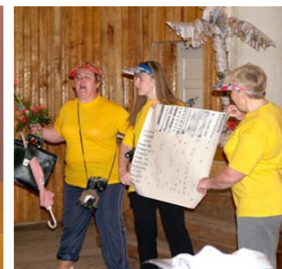
„Spicā Spalva” pie mums Mētrienā. Ciemos kolēģi no Murmastienes pagasta.