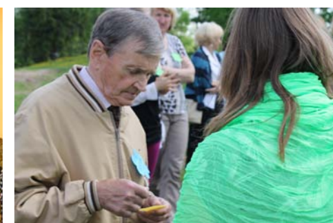
Viens no čaklākajiem rakstītājiem Ilmārs Grudulis.