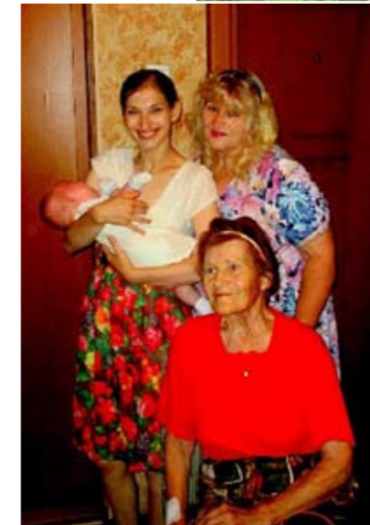
Četras paaudzes kopā.