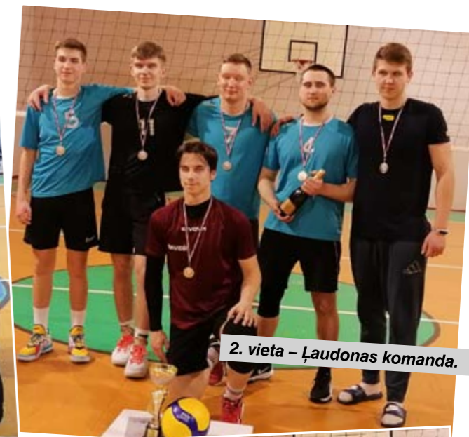
2. vieta – Ļaudonas komanda.