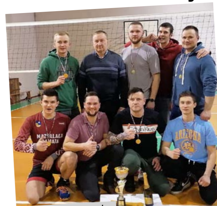
1. vieta – Ramatas komanda.