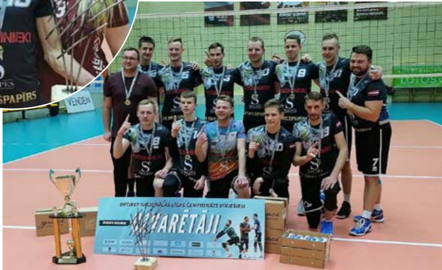
Optibet Latvijas čempionāts 21/22 fināla, kurā uzvarēja Vecumnieku volejbola komanda