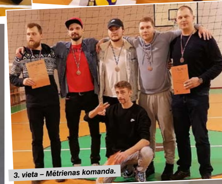
3. vieta – Mētrienas komanda.