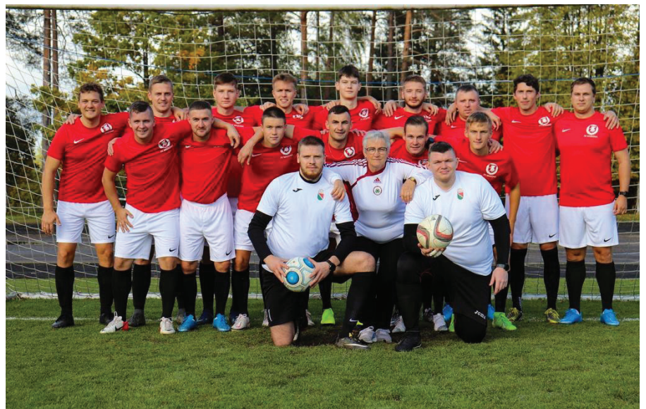
Kopā ar futbola klubu "Madona".