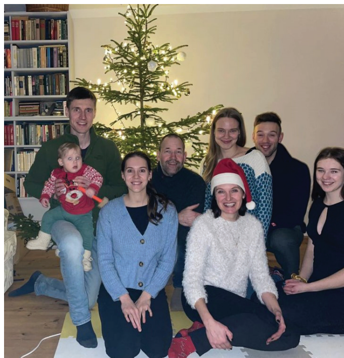
Vīgantņu ģimene Ziemassvētkos.