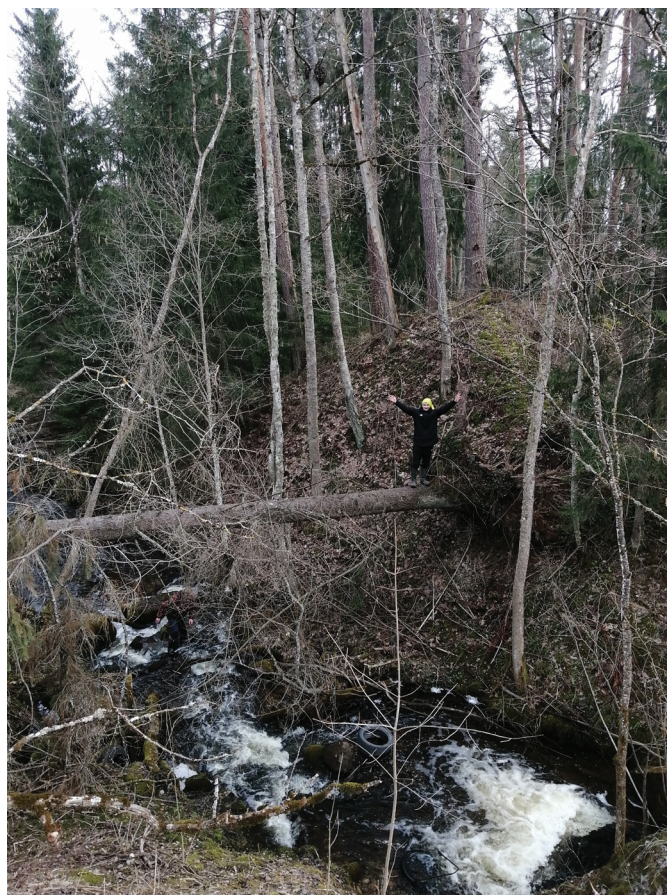
Pastaigas laikā gar Libes upi.