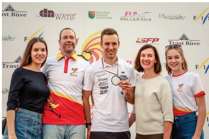
Pēc veiksmīga starta 2019. gada pasaules čempionāta rollerslēpošanā Madonā.