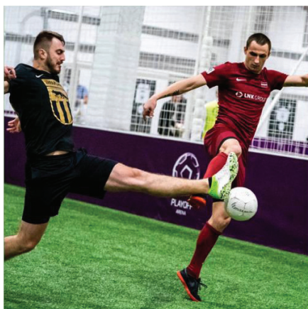
Futbols – liela daļa no manas dzīves.