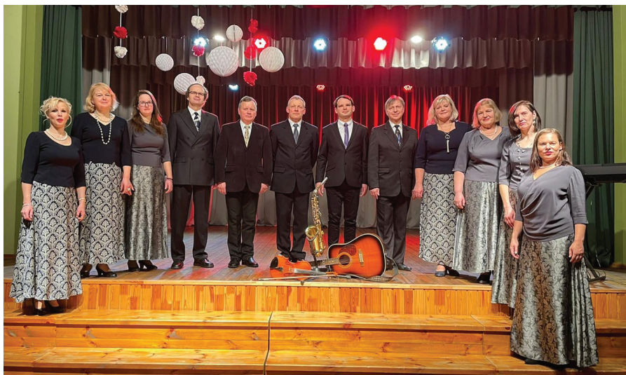
“Rondo” Saikavas tautas namā.