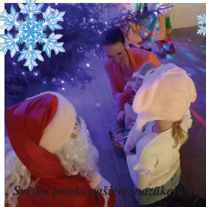
Svētku prieks pašiem un zūkaļiem.

19. decembrī koncertā "Kalnagravās" klātienē varējām vērot vidējās paaudzes deju kolektīvu "Kalnagravas" un senioru deju kolektīvu "Senči". Virtuālu sveicienu no skatuves ekrāna sūtīja vokālais ansamblis "Rondo" un bērnu deju kolektīvs "Avotiņš". Tāpat ar deju mūzikas ritmiem priecēja grupa "Ķirmji".