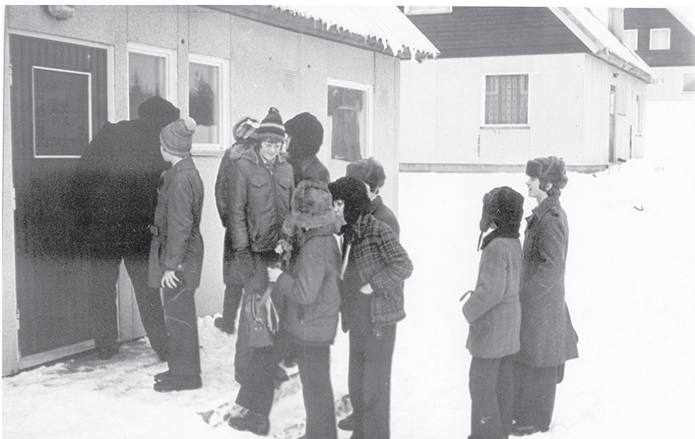
Viena no mājām tiek skatīta arī no iekšpuses. 1981. g. februārī.

7. klasei pārgājiena maršrutā vēl divi objekti – kolhoza cūku ferma "Saulaines" (pasākuma sākumā) un siena miltu kalte "Poteris" pārgājiena nobeigumā, jo šie abi objekti arī saistās ar jaunumiem celtniecībā tajā laikā, tā sauktajā 10. piecgadē (1976-1980). Arī par šiem objektiem savāktas ziņas, ir foto.