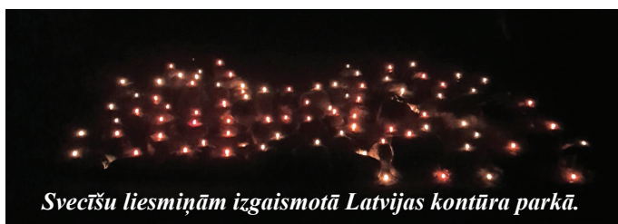
Svecīšu liesmiņām izgaismotā Latvijas kontūra parkā.

klūva krāsainākas, un gaismu rotaļas kopā ar vokālā ansambļa “Rondo” iedziedātajām melodijām radīja svētku noskaņu. Tradicionāli ar svecītēm tika izgaismots vides objekts “Kontakts” Latvijas kartes formā. Tas tāpat kā kāpnes uz estrādi tika izgaismots ar svecītēm, ko sarūpēja gan pagasta pārvalde, gan paši iedzīvotāji. Paldies visiem par iesaistīšanos!