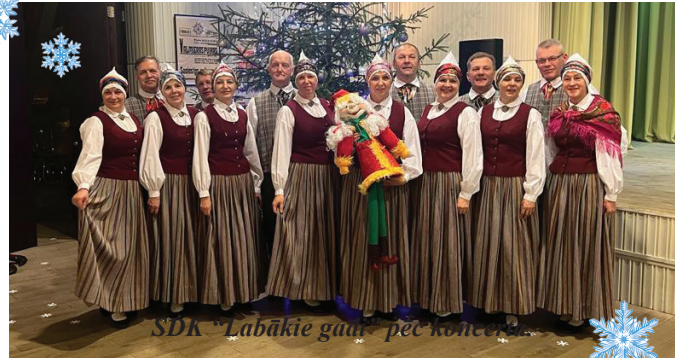
SDK "Labākie gadi" pēc koncerta.

25. decembrī Biksēres centrā pie eglītes piestāja īpašas Rūķu un Sniegbaltītes muzikālas autokamanas. Par spīti aukstajam laikam, muzicējošais sastāvs priecēja apmeklētājus ar programmu, kurā skanēja pazīstamas un populāras Ziemassvētku dziesmas. Tāpat pašiem mazākajiem bija iespēja Rūķim noskaitīt dzejojīti. Vēriģākie muzikālo rūķu tēlos atpazīna grupu "Sokrāta brīvdienas" no Degumnieku puses, un Biksēre bija viena no viņu koncertbrauciena pieturvietām Ziemassvētkos.