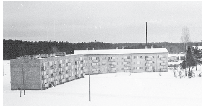
Tās pagaidām ir vienīgās trīsstāvu dzīvojamās mājas Biksēres ciematā. 1981. g. februārī.

Biksēres centrā skolēni tiek iepazīstināti ar Līvānu tipa māju celtniecību. Pēdējo divu gadu laikā uzceltas 10 šādas dzīvojamās mājas. Tā kā neviens no skolēniem tādā mājā iekšā nav