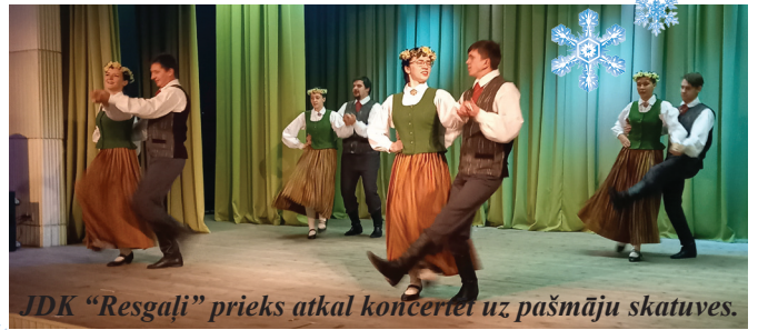
JDK "Resgaļi" prieks atkal koncertēt uz pašmāju skatuves.

23. decembrī skatītājus priecēja jauniešu deju kolektīvs "Resgaļi" un senioru deju kolektīvs "Labākie gadi".