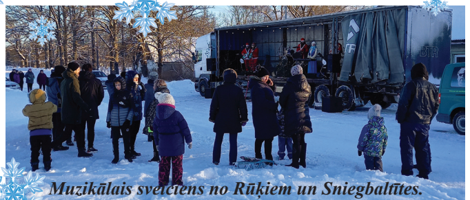
Muzikālais sveiciens no Rūķiem un Sniegbaltītes.