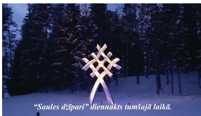
“Saules dzīpari” diennakts tumšajā laikā.

no ievērojama attāluma arī garāmbraucēji varēja ievērot kalna galā izgaismoto Bikšēres muižu. 18. novembra vakarā gaismas