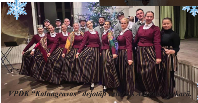
VPDK "Kalnagravas" dejotāji cenšas atgriezties uz skatuvi.

18. decembrī uz eglīti "Kalnagravās" tika aicināti paši mazākie sarkanieši, kuri neapmeklēja pirmsskolas izglītības iestādes. Katru ģimeni sagaidīja Ziemassvētku vecītis, iepazīstinot sa-