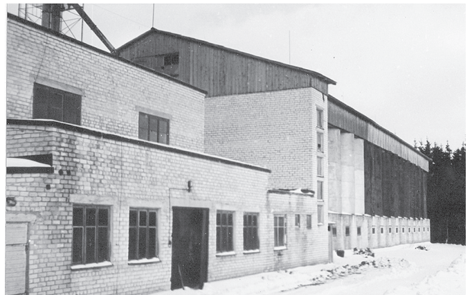
Graudu kalte un reizē klēts ar 64 bunkuriem.