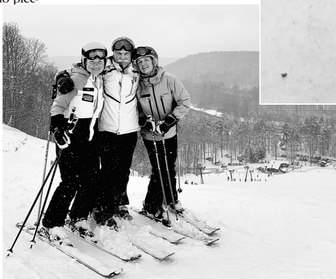
Slēpošana ar meitām 2020. gads Gaiziņš.

mas. Kad viņas nobrauc lejā izrādās divas no viņām mums pazīstamas. Meitenes saka, ka viņas esot apmetušās Pelādēs un viņām nav, kas iekurina krāsni. Mums divreiz nav jāsaka. Mēs esam gatavi kurinātāji. Tā mēs- trīs meičas un trīs čaļi toreiz visu ziemas brīvlaiku nodzīvojām Pelādēs, slēpojot Dienvidniekā un Golgātā. Tik ilgi slēpojām, kamēr aizslēpojāmies, ar vienu no satiktajām meitenēm tajā rudenī arī apprecējos.