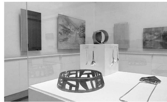
Izstādes atklāšana Madonā 2015. g.