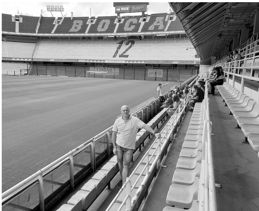
Juris Argentīnas futbola muzejā.

Iestādīti 53 ceriņi un jasmīni, kas pēc gadiem priecēs ar saviem ziediem. Darbs pie mājas un apkārtnes labiekārtošanas turpinās! Ieceru un ideju ir daudz! Lai pietiek spēka tās realizēt!