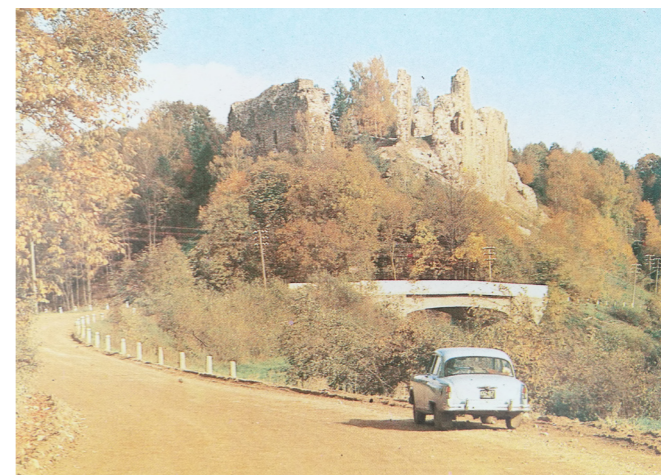
pirms 1965. gada.