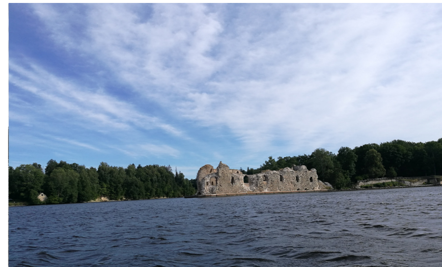
Kokneses pilsdrupas 2021. gadā.