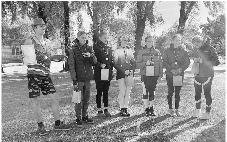
Mirklis pēc skrējiena.

trasīte ar uzdevumiem pašiem mazākajiem sportistiem līdz astoņu gadu vecumam. Prieks, ka bērni nāca kopā ar ģimenēm un mums izdevās viņus mudināt sportot sestdienas dienā, kad visiem tik ļoti gribas vienkārši atpūsties.