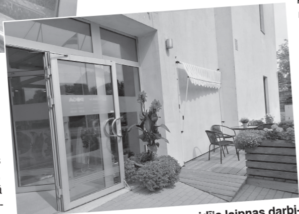
Ziedot.lv birojs, kur mūs sagaidīja laipnas darbinieces, lai atdotu mantas.

Busiņš gatavs doties no Rīgas uz Degumniekiem.