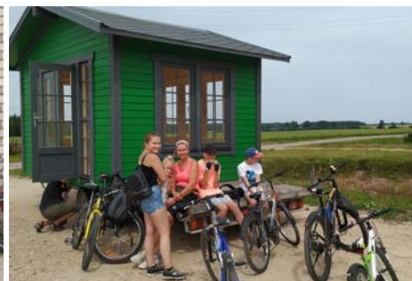
Koka mājiņu ražotne.