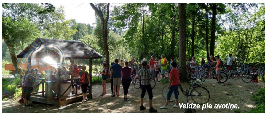
Veldze pie avotiņa.

Sakām paldies visiem, kuri piedalījās – gan vietējiem, gan ciemiņiem. Sīrņīgs paldies visiem saimniekiem, kas mūs uzņēma.