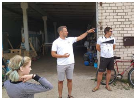
Pie brāļiem Miteniekiem.