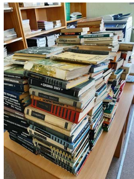
Vecās grāmatas tika norakstītas.

Ja Jums ir neskaidri jautājumi, ierosinājumi, vai vajadzīga informācija, rakstiet e-pastā: metrienasbiblioteka@madona.lv vai zvaniet uz tālruni 20371432. Tāpat bibliotēkas aktualitātēm var sekot sociālajos tīklos https://www.facebook.com .