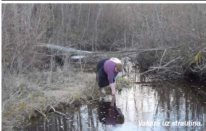
Vakarā uz strautiņa.