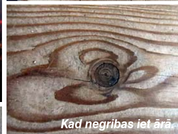
Kad negribas iet ārā.