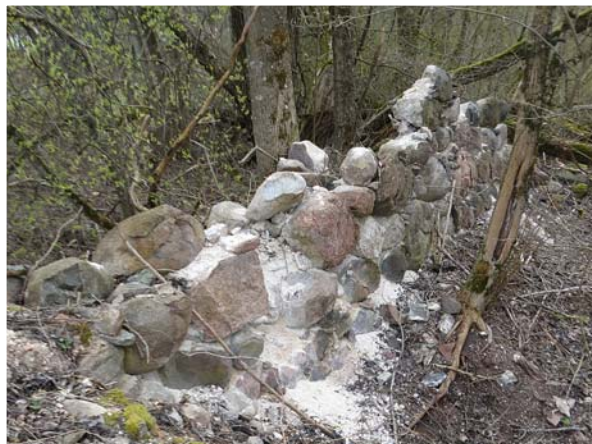
Par vietu atgādina tikai akmeņu krāvumi