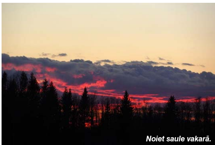
Noiet saule vakarā.

Materiālu sagatavoja Solvīta Stulpiņa