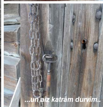
...un aiz katrām durvīm..