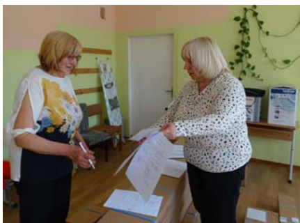
Tiek parakstīti līgumi.