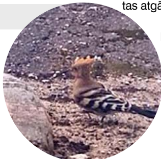
Pie pirmsskolas iestādes pupuķis.

To nobildējušas, pēc tam interesējušas, kas tas ir par putnu. Pēc visām pazīmēs