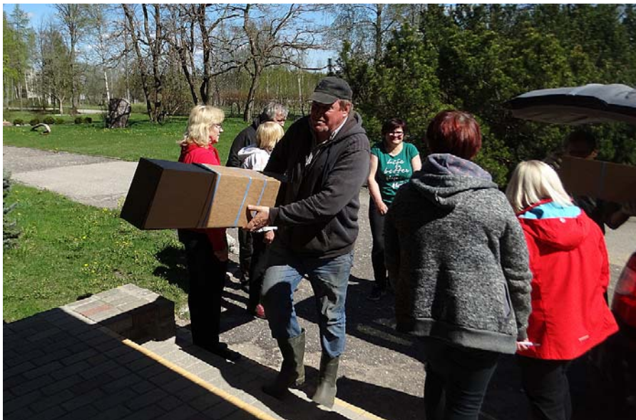
Lai smagās stelles nogādātu uz otro stāvu, palīgā nāca vīrieši.