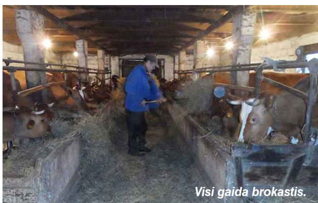
Visi gaida brokastis.