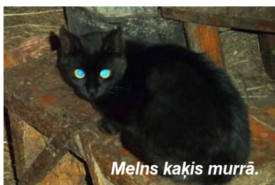
Melns kaķis murrā.