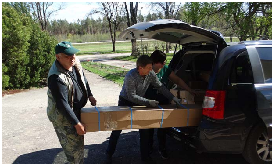
Lai smagās stelles nogādātu uz otro stāvu, palīgā nāca vīrieši.