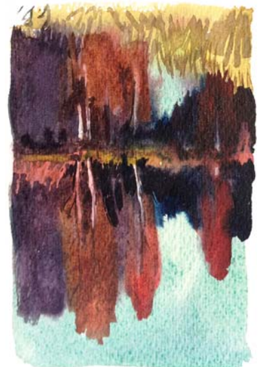
Draugiem dāvāts paša gleznots akvarelis.