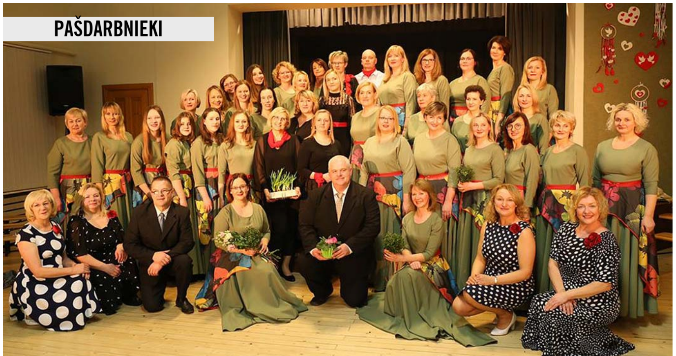
Koncerta dalībnieku kopbilde.