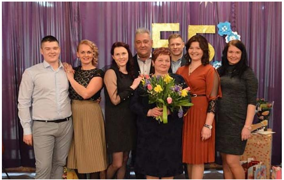
Jubilāre savu vismīļāko vidū.

Mammai ļoti patīk apmeklēt kultūras pasākumus, tāpēc, ja iespējams, mēs viņai dāvinām biļetes uz dažādiem pasākumiem, lai mamma varētu izrauties no ikdienas rutīnas.