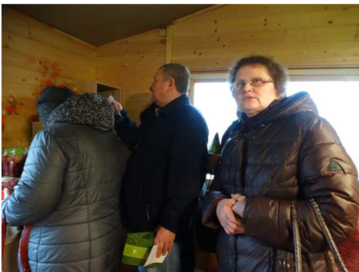
Vēdīsim mājīniekiem veselīgos čipsus!