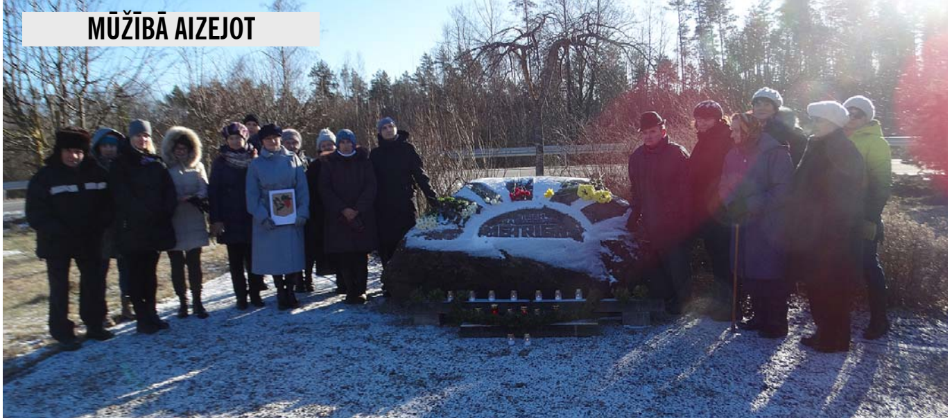
Atvadu brīdis Piemiņas parkā.

šajā kaujā it neviens līdz šim uzvarējis nav un neuzvarēs ozoli vēl dziļāk iesakņosies tēvu zemes ārēs liepas aizvien augstāk pacelsies pie debesīm