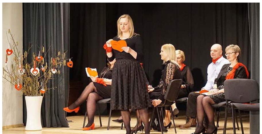
Mirklis no „MaskaRādes” uzstāšanās.

deva saspringtā laikā, kā pozitīvs lādiņš, kad jau sāk „beigties baterijas”.