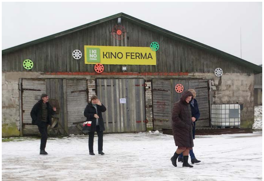
Esam pie cūku fermas, nē... kino fermas.