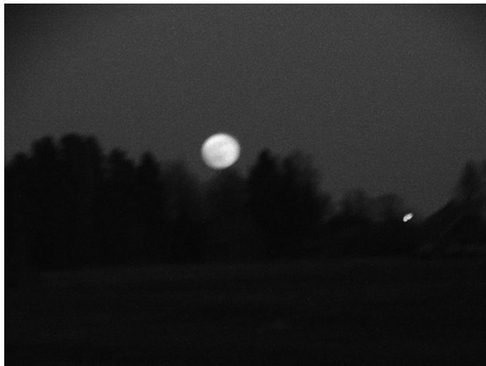
Tāds tovakar bija mūsu pavadonis – mēness.