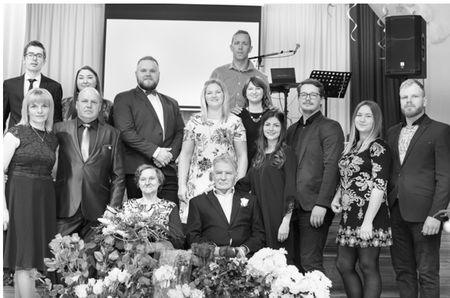
Kopā ar bērniem un mazbērniem.