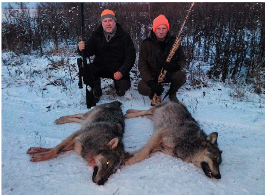
Vilki. 2019. gada 1. decembris.