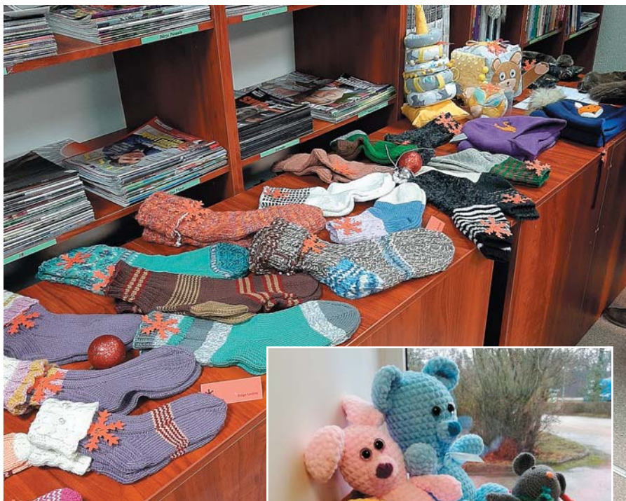
Visvairāk izstādē tika pārstāvētas adītas siltas ziemas zeķes.