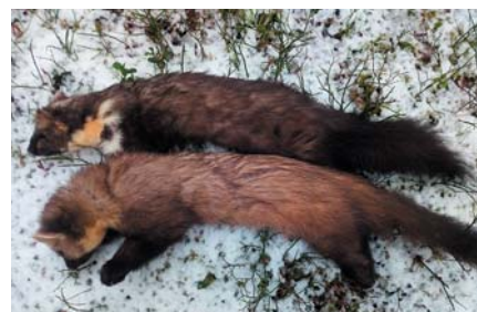
Kaspāra Roziša caunas.