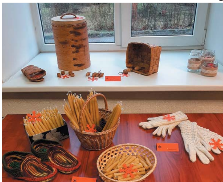
Vizmas Krastas dāsnašas vaska sveču klāsts.