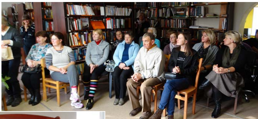
Uz pasākumu ieradušies 29 interesenti.