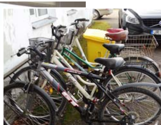
Veliņi gatavi ceļam!