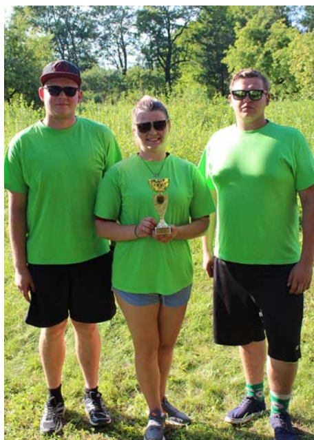
Baļķu cīņu dalībnieki.