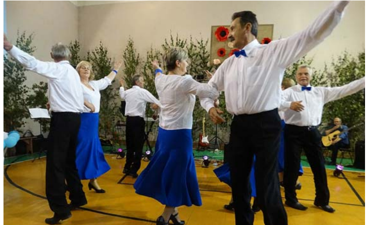
Sveiciens no SDK „Mētra”.