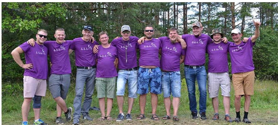
Mētrienas mednieku komanda.