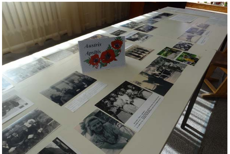
Austra Apsīša veidotā skolas vēstures izstāde.