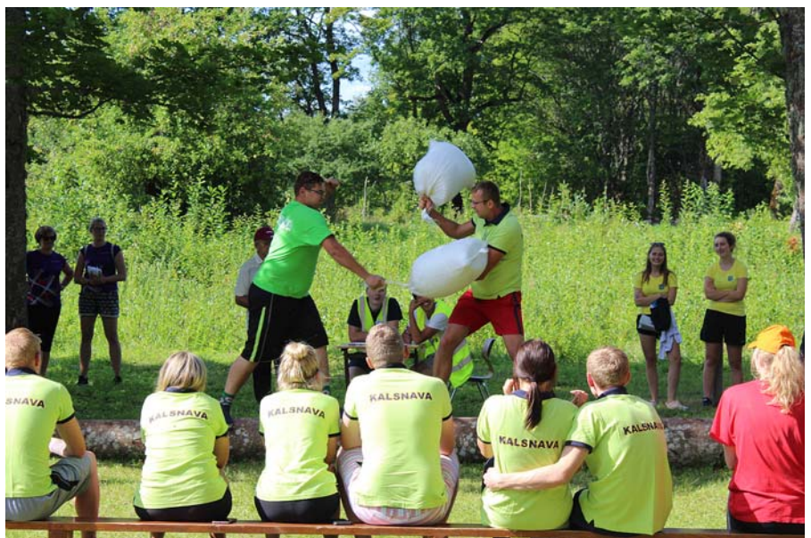
Cīņas uz baļķa.