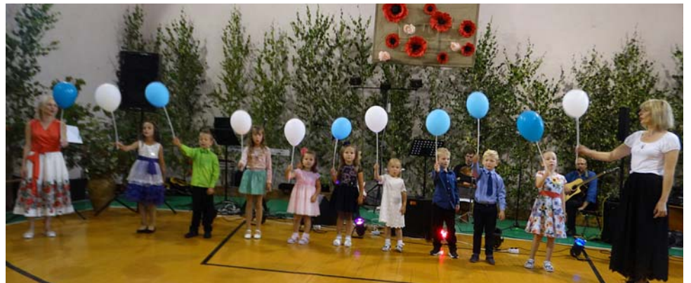
Pirmsskolas izglītības grupas audzēkņi.