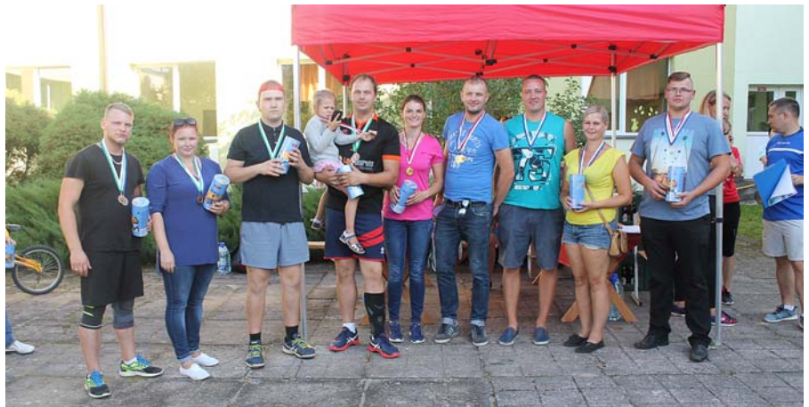
Mašīnas stumšanas uzvarētāji.

17.00 ar pozitīvām emocijām tika aizvadīta apbalvošana. Pirmo trīs vietu ieguvējiem katrā disciplīnā tika pasniegtas medaļas, volejbola komandām kausi un spēlētājiem medaļas.