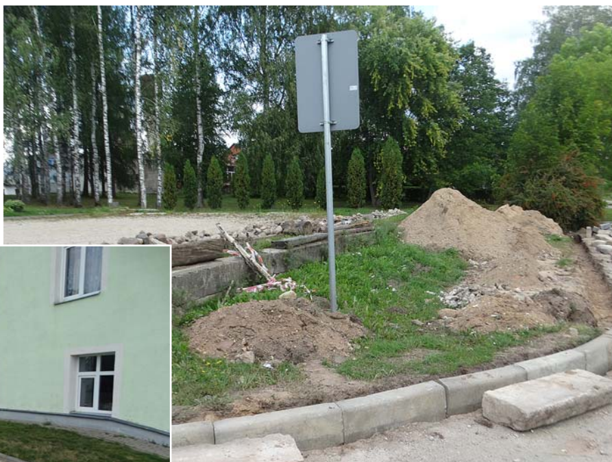
Darbi rit pie pieturas vietas iekārtošanas.

Jāatzīst, ka labiekārtošanas darbi šajā vietā sen bija nepieciešami, jo, lai ieltu tautas namā, bieži vien nācās mīt dubļus.