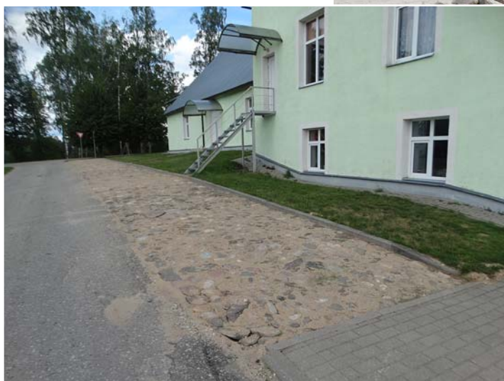
Bruģa segums pie tautas nama.