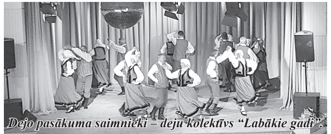
Dejo pasākuma saimnieki – deju kolektīvs "Labākie gadi".

27. aprīlī senioru deju kolektīvs "Senči" viesojās Ogres novada Meņģelē, kur piedalījās deju kolektīvu sadancī.