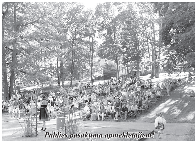
Paldies pasākuma apmeklētājiem!