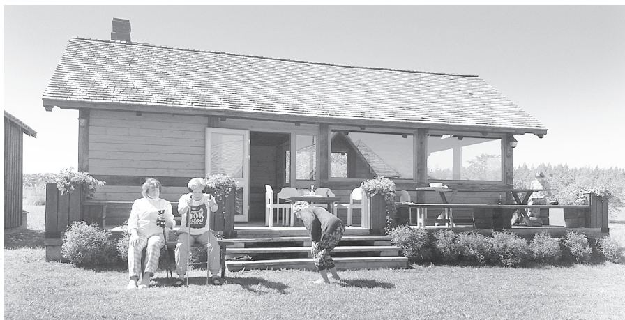
Teātra izrāde kempingā “Rozītes”.

Sākot mājupceļu, vēl iegriežamies Cesvaines katoļu baznīcā, kur ar tās darbību un telpām mūs iepazīstina draudzes