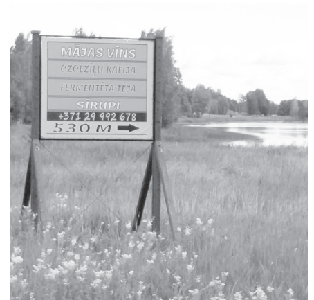
Jaunais uzņēmums aicina.

Esiet laipni gaidīti! Labprāt iepazīstināšu ar produkciju, ko ir iespējams arī degustēt un uzziņāt, kā to pareizi pagatavot un lietot. Ir daudzas lietas, ko ikdienā vēl nezinām. Augi, kas pie mums aug, satur ļoti daudz vērtīgu lietu. Atliek tikai tos pareizi izmantot, lai labās īpašības, kas tiem piemīt, dotu maksimālu efektu. Kā piemēru var minēt dienviņu augu kurkumu, kura sakne pasaulē jau izsenis tiek izmantota medicīnā un to dēvē par mūžīgo jaunības eliksīru. Ļoti līdzīgas īpašības ir pie mums plaši sastopamajām pienenēm. Tāpēc tam vienkārši jāpievērš pienācīga uzmanība. Pieneņu sakņu pulveris pieejams arī mūsu uzņēmumā, tāpat arī topinambūru pulveris, kas arī