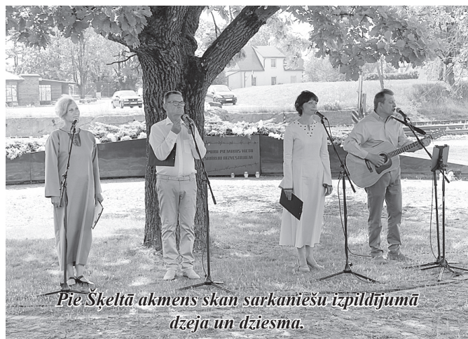
Pie Šķeltā akmens skan sarkaniešu izpildījumā dzeja un dziesma.