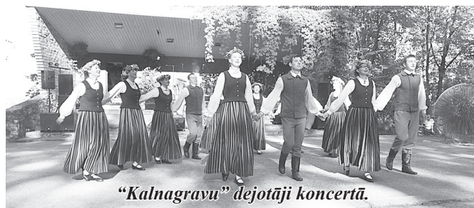
“Kalnagravu” deju kolektīva koncertā.