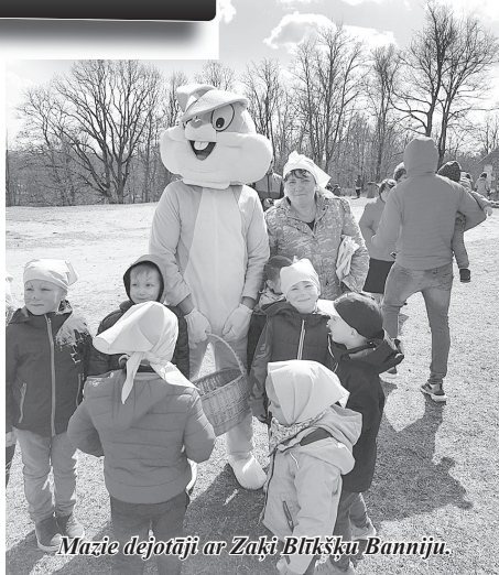
Mazie dejotāji ar Zaķi Blikšķu Banniju.

izmēģināt savas spējas dažādu uzdevumu veikšanā, stafetēs, dārgumu meklēšanā, kārtīgi izšūpoties, noskatīties Sarkaņu mazo dejotāju sniegumu, iepazīties ar Zaķi Blikšķu Banniju un ieklausīties tautas muzikantu sniegumā.