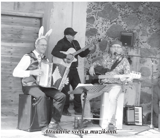
Atraktīvie svētku muzikanti.