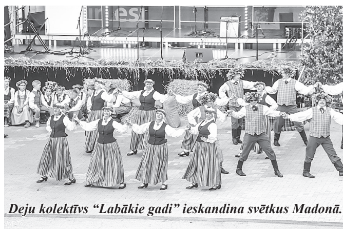
Deju kolektīvs “Labākie gadi” ieskandina svētkus Madonā.

22. jūnijā senioru deju kolektīvs “Labākie gadi” Madonā piedalījās koncertā “Ieligosim saulgriežus!”.