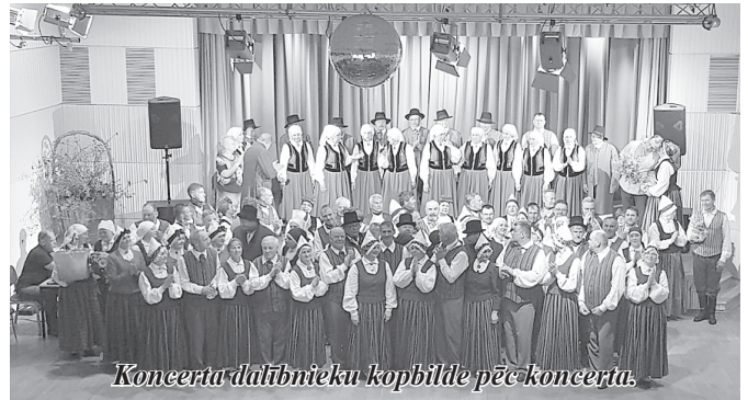
Koncerta dalībnieku kopbilde pēc koncerta.

27. aprīlī uz sadanci "Ielūdz "Labākie gadi"" pulcējās deju kolektīvi "Tacis" no Carnikavas, "Jersikietis" no Līvānu novada, "Vērdiņš" no Gulbenes, "Meirāni" no Lubānas novada, "Jāņukalns" no Kalsnavas pagasta un mājiniēki – deju kolektīvs "Labākie gadi".