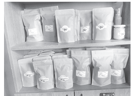
Daļa no daudzveidīgās produkcijas.

satur daudzas ļoti vērtīgas sastāvdaļas, un to var pievienot ēdienam.