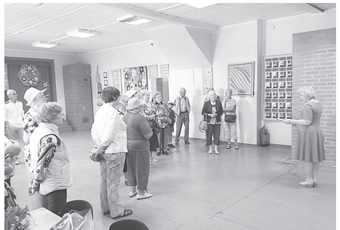
Kraukļu skolas zālē.