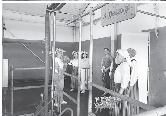
Z/s "Madaras" iepazīstot.