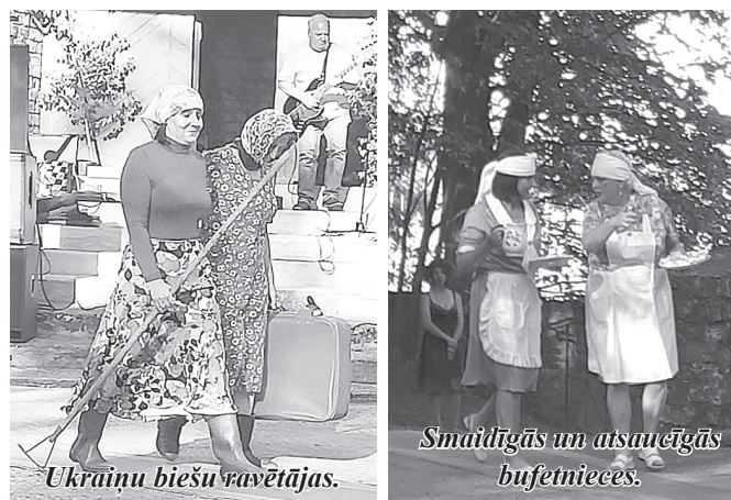
Ukrāņu biešu ravētājas.