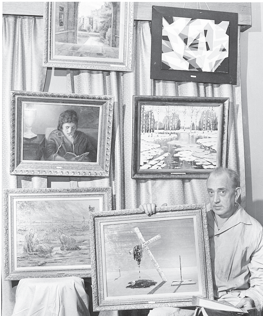
Kalme ar savām gleznām 1966. gadā.