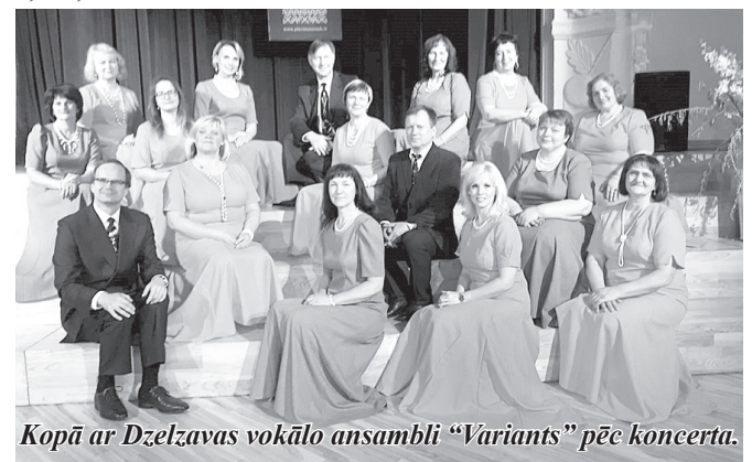
Kopā ar Dzelzavas vokālo ansambli "Variants" pēc koncerta.

4. maijā vokālais ansamblis "Rondo" piedalījās koncertā Pļaviņu kultūras namā.