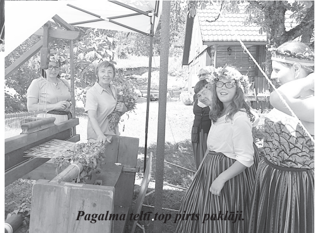
Pagalma telī top pirts paklāji.

Izbraukuma laikā dažās no mājām saimniekus nesatiekam, bet par to ne-