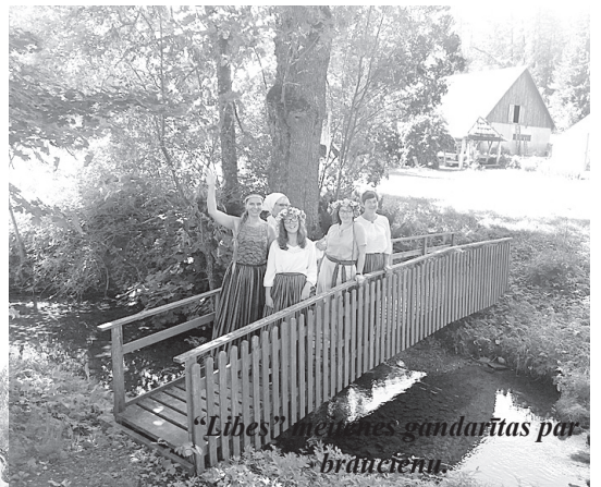
“Libes” mājās gandarītas par brāncienu.

skumstam, jo ir patiens prieks paceļot pa pagasta smilšsainajiem ceļiem, papriecāties par ziedošajām pļavām, dabas ainavām un cilvēku veikumu, jo katrs cenšas savas mājas, savu sētu sakopt, ne tikai