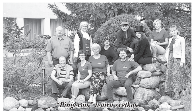
"Piņģerots" teātra svētkos.

25. maijā amatiereteātris "Piņģerots" ar pasaku lugu "Gāganu kari" viesojās Suntažos, kur piedalījās teātra spēlēšanas svētkos un amatiereteātra "Sauja" 15 gadu jubilejas pasākumā.