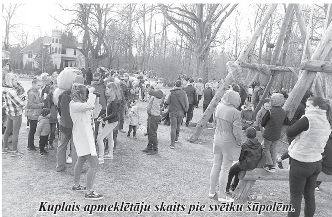
Kuplais apmeklētāju skaits pie svētku šūpolēm.

27. aprīlī uz sadanci "Ielūdz "Labākie gadi"" pulcējās deju kolektīvi "Tacis" no Carnikavas, "Jersikietis" no Līvānu novada, "Vērdiņš" no Gulbenes, "Meirāni" no Lubānas novada, "Jāņukalns" no Kalsnavas pagasta un mājiniēki – deju kolektīvs "Labākie gadi".