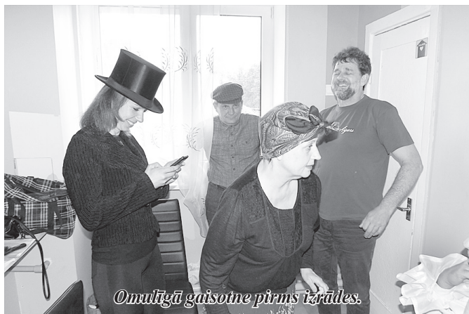
Omulīgā gaisotne pirms izrādes.

7. jūnijā akcijas “Baznīcu nakts” koncertos Cesvaines un Bērzaunes luterāņu baznīcā koncertēja vokālais ansamblis “Rondo”.