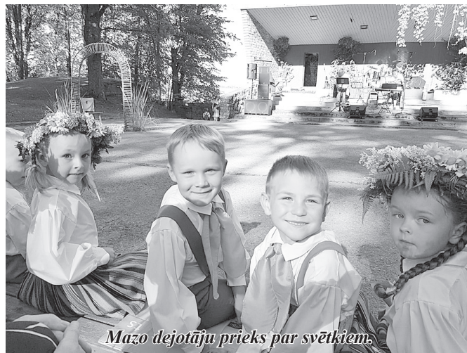
Mazo deju kolektīva priekšnesums par svētkiem.

“Piņģerots” aktieri un viņu atbalstītāji, arī deju kolektīva “Kalnagravas” pārstāvji. Ar muzikāliem priekšnesumiem pasākumu kuplināja un zaļumballē spēlēja pašmāju grupa “Māgas”.