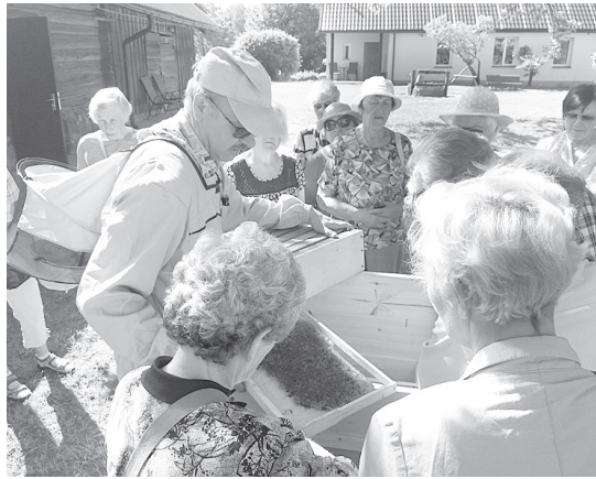
Biškopja padomus uzklausat.

tas māju vēsturi, gan par saimniekošanu bišu dravā. Zem kuplā, varenā ozola mājas pagalmā degustējām produkciju, kas iegūta no bišu ikdienas darbošanās, un uzzinām daudz ko jaunu par bitēm un biškopību.