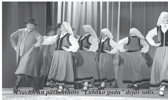
Precis un pārhecināšs “Labāko gadu” dejas solis.

13. aprīlī deju kolektīvi “Kalnagravas” un “Senči” piedalījās Madonas deju aprīņa dejotāju koncertā – skatē, kas notika Cesvaines vidusskolas aulā.