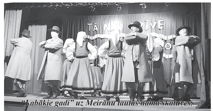
"Labākie gadi" uz Meirānu tautas nama skatuves.

23. februārī deju kolektīvs "Labākie gadi" viesojās Meirānu tautas namā un piedalījās deju kolektīvu sadraudzības pasākumā "Tāda ir dzīve".