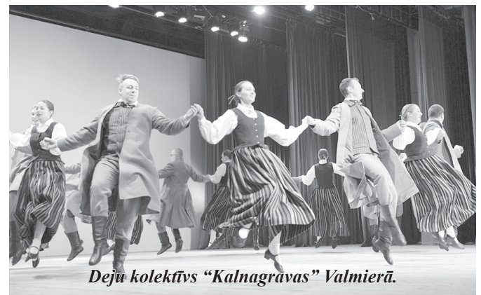
Deju kolektīvs "Kalnagravas" Valmierā.

2. martā vidējās paaudzes deju kolektīvs viesojās Valmieras Kultūras centrā un piedalījās koncertā "Tāda ir dzīve".