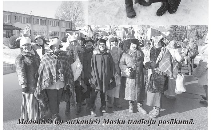
Mudonieši un sarkanieši Masku tradīciju pasākumā.

23. februārī deju kolektīvs "Labākie gadi" viesojās Meirānu tautas namā un piedalījās deju kolektīvu sadraudzības pasākumā "Tāda ir dzīve".