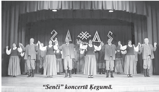
"Senči" koncertā Ķegumā.

12. janvārī deju kolektīvs "Senči" viesojās Ķegumā, kur piedalījās deju kolektīvu sadancī "Pašā ziemas viducī". Kopā ar sarkaniešiem koncertā piedalījās deju kolektīvi "Sidrabaine" (Ķekava), "Rīgava" (Salaspils), "Lēdmane" (Lēdmane), "Sprigulī" (Ādaži), "Ziemeļblāzma" (Rīga) un "Degļi" (Baldone).