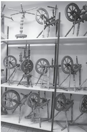
Krātuvē iekārtota telpa lina un vilnas apstrādes rīkiem.

Krātuves apmeklējums un aktivitātes – bez maksas