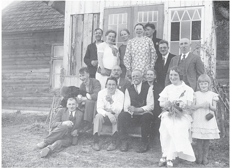
1935. gads “Cīruļkalnā”.