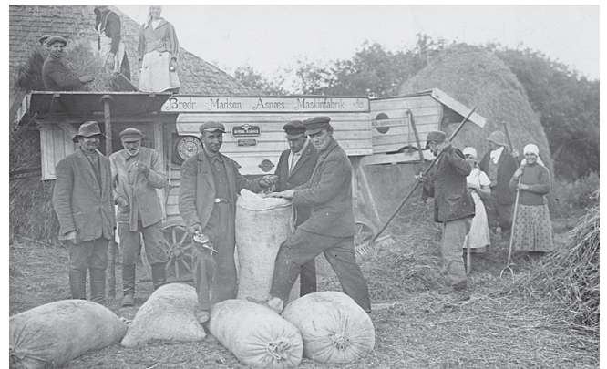
Kulšanas talka Patkules "Pagrabiešos" pie Pavāriem. 1930. gadu 2. puse.