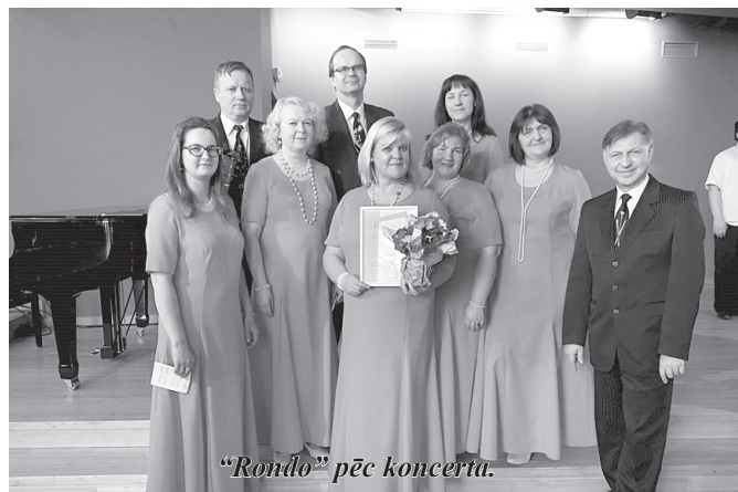
“Rondo” pēc koncerta.

13. aprīlī vokālais ansamblis “Rondo” viesojās Ādažu kultūras centrā un ar savām skaņīgajām balsīm piedalījās koncertā “Tik pie Gaujas”. Kopā ar sarkaniešiem koncertā piedalījās deviņi dziedoši kolektīvi no dažādām Latvijas vietām.