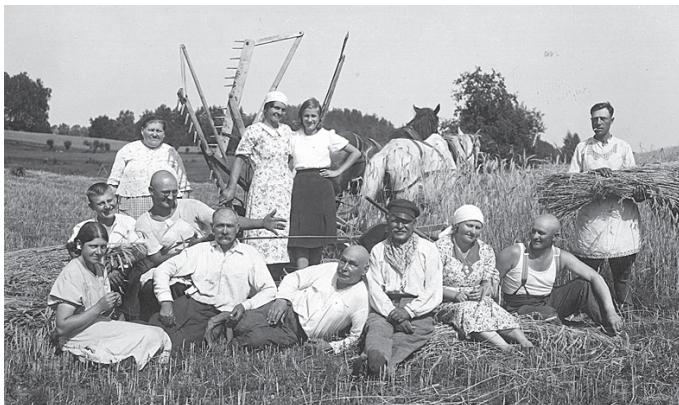
Rudzu pļaušanas talcinieki tīrumā Sarkaņu pagasta "Lībiešos". 1939. gads.