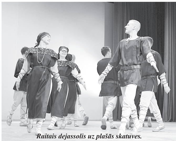
Raitais dejassolis uz plašās skatuves.

17. martā J. Norviļa Madonas mūzikas skolā norisinājās Madonas novada vokālo ansambļu skate. Skatē piedalījās 12 ansambļi no visa novada. Veiksmīgs un skaņīgs bija vokālā ansambļa “Rondo” sniegums. Žūrija ansambļa sniegumu novērtēja ļoti atzinīgi – ar 41.33 punktiem – un godam izcīnītu I pakāpi.