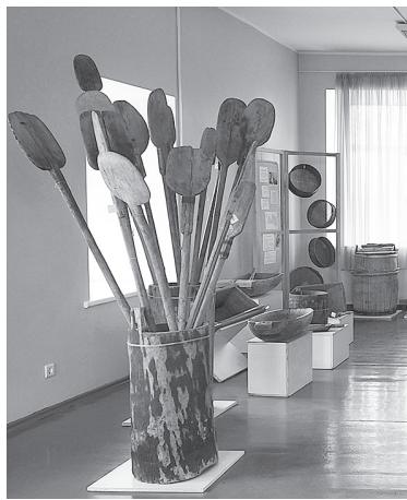
Izstādē "Neba maize pate nāca".