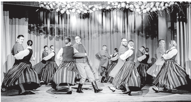
Pasākuma saimnieki "Kalnagravu" dejotāji.

9. februārī "Kalnagravās" uz deju kolektīvu sadanci "Deju kupenā" aicināja vidējās paaudzes deju kolektīvs "Kalnagravas". Ciemos pie mūsu dejotājiem bija ieradušies tuvāki un tālāki ciemiņi – deju kolektīvi "Usma" (Ventspils novads), "Daugavieši" (Līvānu novads), Meirānu tautas nama deju kolektīvs (Lubānas novads) un "Kalsnava". Tāpat pasākumu kuplināja jauniešu koris "Impulss" no Ogres kultūras centra.